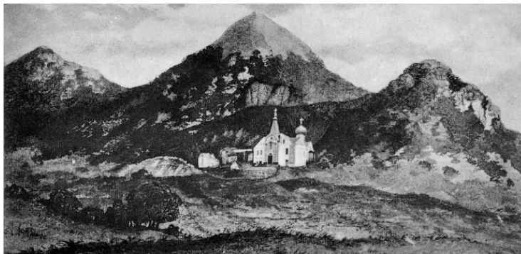
Второ-Афонский Успенский мужской монастырь на горе Бештау. 1905 год

Богомольцев в монастыре привлекала строгая молитвенная сосредоточенность братии, неукоснительное выполнение древнего афонского устава, истовое служение монахов. Особо отмечались случаи исцеления от болезней в Святой обители. Само живописное местоположение монастыря высоко на горе Бештау, на опушке густого леса между ее отрогами, недалеко от святого источника с хрустальной ледяной водой, настраивало душу на молитвенное созерцание. Щедрая природа, поэзия преданий древности, открытость обители пленяли паломников 16 .