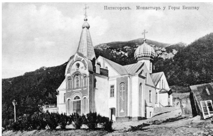
Второ-Афонский Успенский мужской монастырь на горе Бештау. 1905 год

Вседневные службы начинались в четыре часа вечера. Гудело монастырское било, призывая на молитву. После девятого часа служили вечерню, затем предлагался ужин. Поужинав, братия собирались на повечерие, слушали каноны Спасителю, Божией Матери и Ангелу Хранителю. Прослушав общее правило, вечерние молитвы, испросив благословение у настоятеля или наместника, отдыхали.