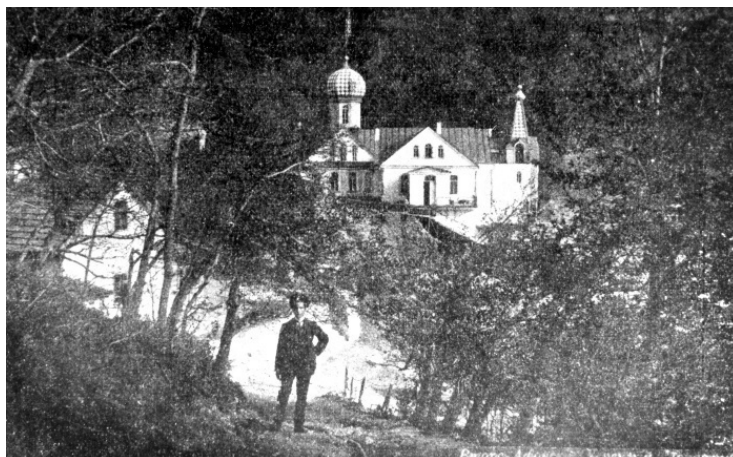
Храм во имя Успения Пресвятой Богородицы Второ-Афонского монастыря. 1905 год

В понедельник – архангелу Михаилу, во вторник – святому Иоанну Крестителю, в среду и субботу – Пресвятой Богородице, в четверг – святому чудотворцу Николаю, в пятницу – Страстям Христовым, в воскресенье – Иисусу Сладчайшему. После пения причастного стиха на литургии народу предлагалось поучение. В воскресные и праздничные дни богослужение имело свои особенности. Во время Первой мировой войны Второ-Афонский Успенский мужской монастырь, как и другие обители, принимал участие в уходе за ранеными, вносил посильную помощь фронту.