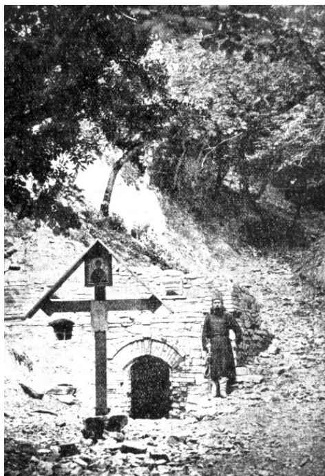
Святой источник Второ-Афонского монастыря на горе Бештау

В понедельник – архангелу Михаилу, во вторник – святому Иоанну Крестителю, в среду и субботу – Пресвятой Богородице, в четверг – святому чудотворцу Николаю, в пятницу – Страстям Христовым, в воскресенье – Иисусу Сладчайшему. После пения причастного стиха на литургии народу предлагалось поучение. В воскресные и праздничные дни богослужение имело свои особенности. Во время Первой мировой войны Второ-Афонский Успенский мужской монастырь, как и другие обители, принимал участие в уходе за ранеными, вносил посильную помощь фронту.