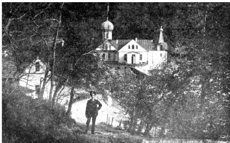
Храм во имя Успения Пресвятой Богородицы Второ-Афонского монастыря. 1905 год

После недолгого отдыха, в половине первого ночи будильщик поднимал монахов на полунощницу, за которой следовали утренняя с первым часом и общие утренние молитвы. После чтения первой кафизмы на утрени предлагалось первое поучение, после шестой песни канона – второе. По окончании девятой песни канона было установлено целование икон. Сразу после чтения первого часа читалось правило для тех, кто готовился ко Святому Причащению 17 . Божественная литургия начиналась в семь часов утра. Перед чтением часов служили Акафисты.