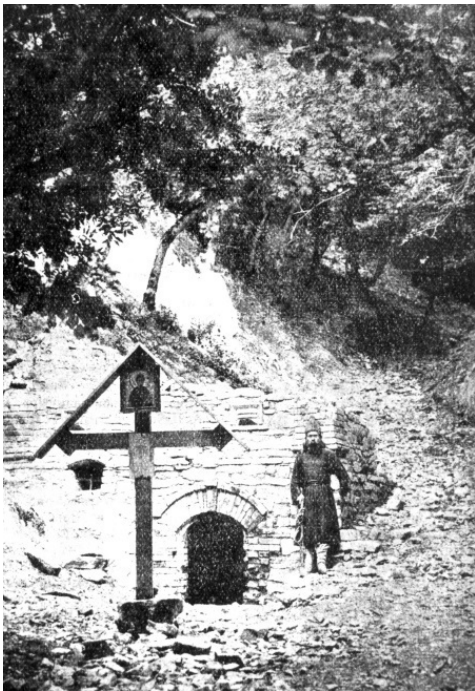
Святой источник Второ-Афонского монастыря на горе Бештау

Впоследствии строй жизни отца Стефана неизменно следовал монастырскому распорядку. Во время пребывания в обители на Бештау был заложен глубокий и прочный фундамент духовной жизни старца. Он исполнял самые разнообразные монастырские послушания: шил одежды и облачения, пек просфоры, работал на огородах и виноградниках,