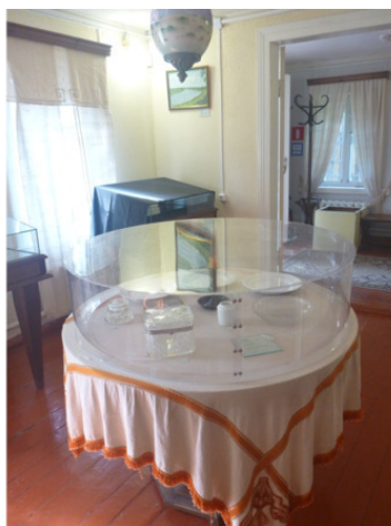
Музей семейства Цветаевых в Тарусе. Столовая.

Здесь хотела бы лежать МАРИНА ЦВЕТАЕВА» Париж, май 1934.»