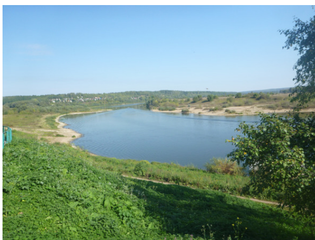
На берегу реки Таруски.

Свое название город получил по названию речки Таруски, которая впадает в полноводную Оку. По другой версии проплывающие по реке путники спрашивали местных жителей, что это за место и в ответ слышали: «То Русь!» И наконец, есть еще одна версия. Поскольку город стоял на реке, а в древности его окружали дремучие леса, то единственным способом сообщения был водный путь, т.е. по проторенной дороге. Отсюда и пошло название города – Таруса, т.е. город, до которого можно добраться только по проторенному пути.