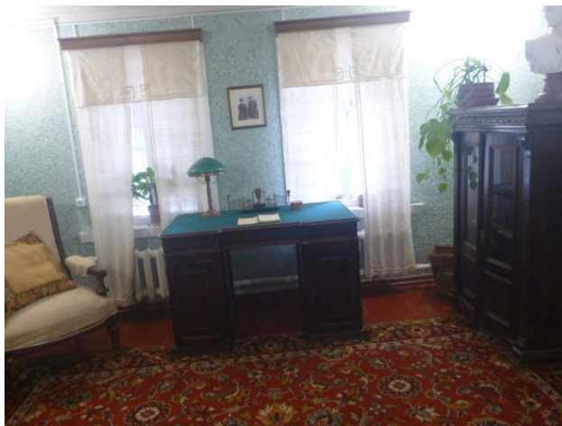
Музей семейства Цветаевых в Тарусе. Кабинет И. В. Цветаева.