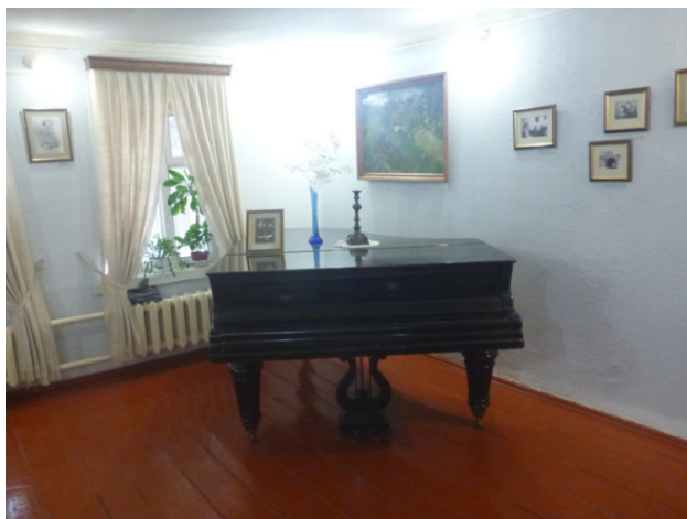
Музей семейства Цветаевых в Тарусе. Беккеровский рояль.