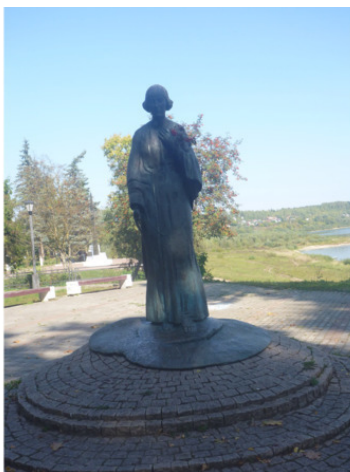
Памятник Марине Цветаевой в Тарусе.

Таруса была излюбленным местом для Марины Ивановны Цветаевой. В конце XIX в ее отец, Иван Владимирович Цветаев (основатель Музея Изящных Искусств – ныне музей изобразительных искусств им. А. С. Пушкина) приехал в гости к своим родственникам в Тарусу и полюбил эти живописные места. С 1882 по 1910 г. семейство Цветаевых проводило летние месяцы на даче «Песочное» в Тарусе. Все свое детство и юность Марина провела здесь. Живописные места, полноводная Ока и пологие берега, усыпанные земляникой, леса и овраги – все это не могло никого оставить равнодушным. Детские впечатления – самые яркие. И свои первые стихи Марина тоже посвятила Тарусе.