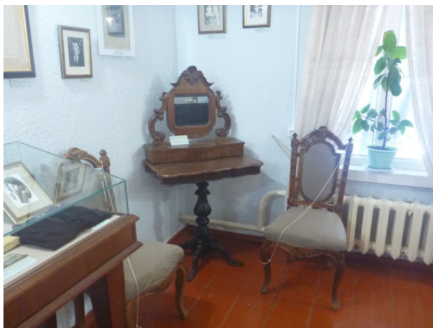
Музей семейства Цветаевых в Тарусе. Туалетный столик.