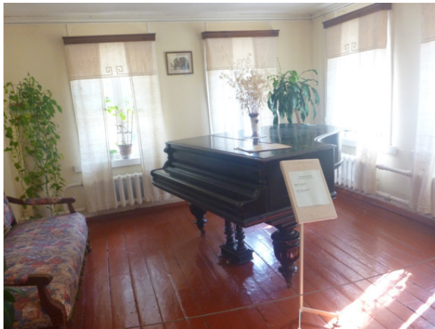
Музей семейства Цветаевых в Тарусе. Гостиная.