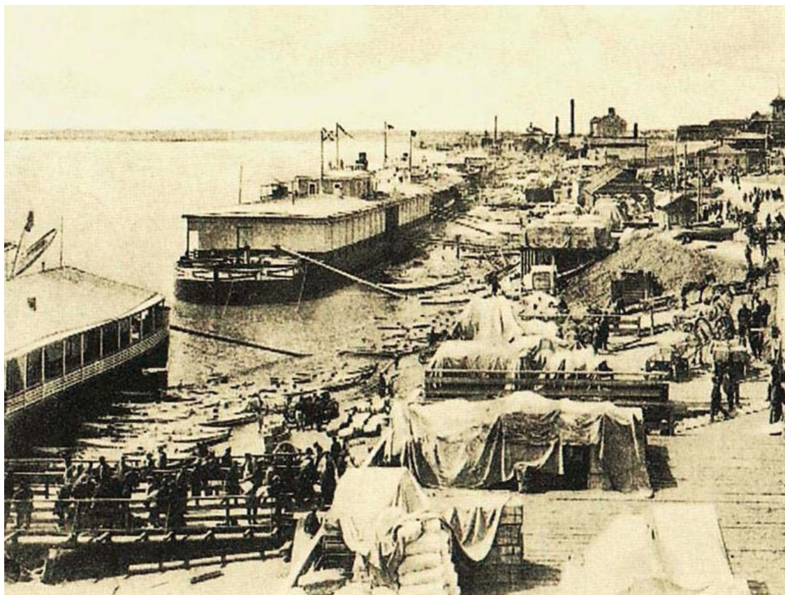
Саратов. 19 век. Пассажирская пристань

Саратовский край – благодатный край в самом центре России. Бескрайние ковыльные степи, березовые рощи, пшеничные поля до самого горизонта... Трескучие морозы зимой и жаркое летнее солнце. И среди этого великолепия неспешно катит свои воды царица русских рек великая Волга. Не случайно, издавна привлекал этот край своим раздольем «пришлых» людей.