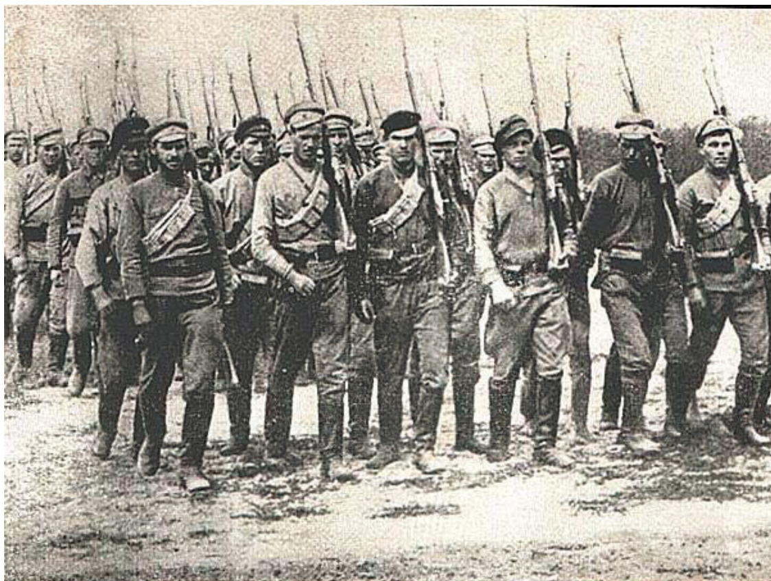
1-й Советский (Самарский) полк на марше

Самарский полк находился в самом центре сражений. В боях с подготовленными и хорошо оснащенными войсками атамана Дутова и адмирала Колчака красноармейцы ежедневно теряли десятки своих товарищей. Но еще больше, чем в людских ресурсах молодая Красная армия испытывала дефицит командных кадров.