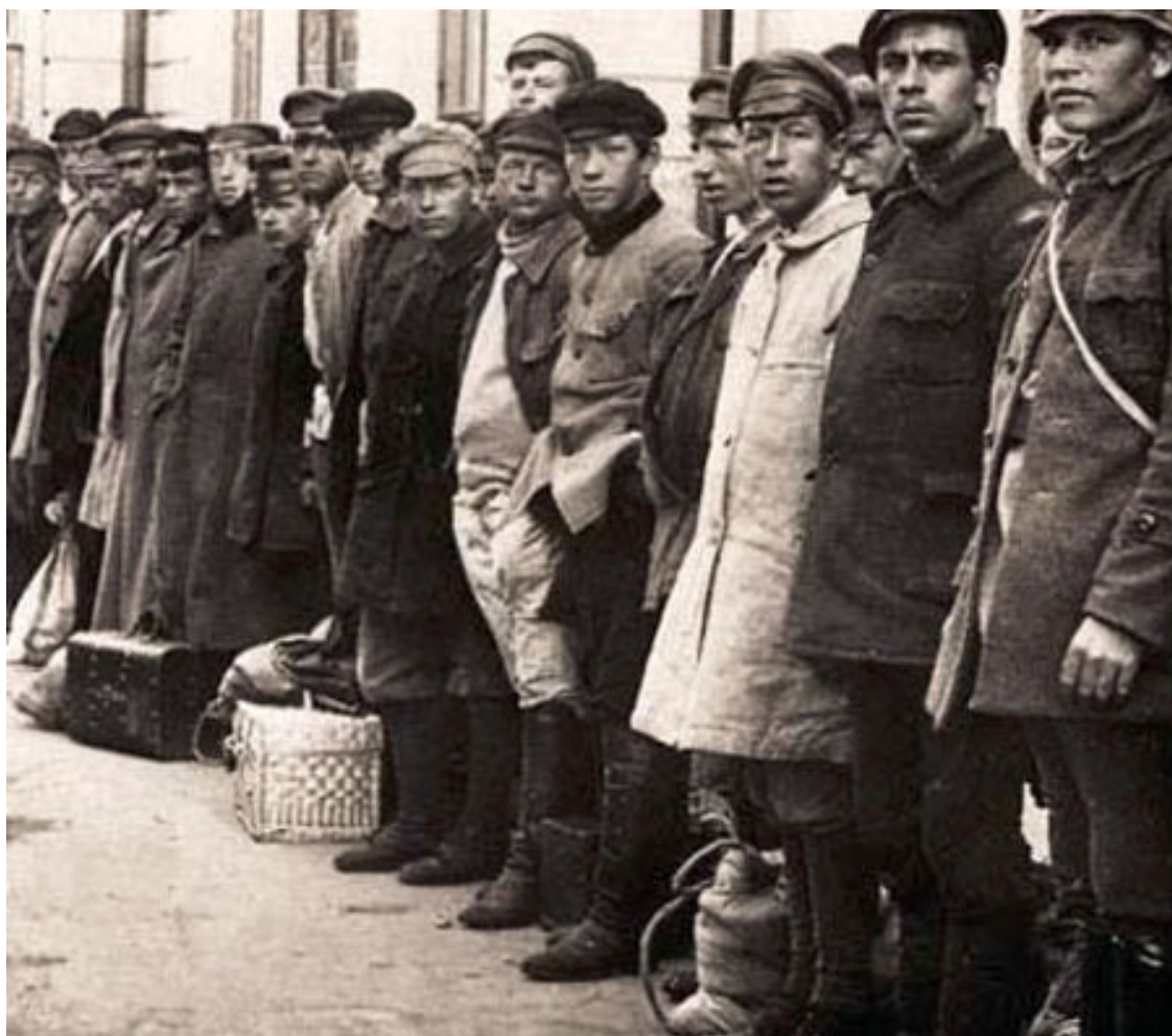
Мобилизация крестьян Поволжья на Южный фронт

Единственной силой, которая могла противостоять постоянно вспыхивающим бунтам и набирающим силы бандитскому движению, были рабочие батальоны и курсанты Саратовских курсов. И курсанты ценой жертв и лишений приобретали на практике бесценный опыт войны.