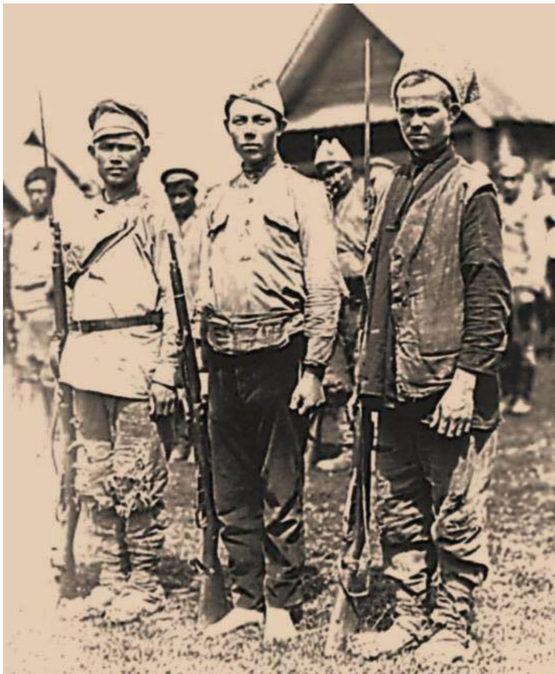
Чапаны – участники крестьянского восстания

Да что это был за паек: 2 фунта хлеба (на всех), 250 грамм овощей и 30 грамм сахара. А денежного довольствия (800 рублей) едва хватало на неделю: фунт хлеба на рынке – 80 рублей, фунт мяса – 350. Иногда помогали астраханские родственники, но редко. Дорога от Астрахани до Саратова в условиях бандитского беспредела была очень сложной.