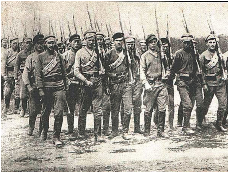
1-й Советский (Самарский) полк на марше

Самарский полк находился в самом центре сражений. В боях с подготовленными и хорошо оснащенными войсками атамана Дутова и адмирала Колчака красноармейцы ежедневно теряли десятки своих товарищей. Но еще больше, чем в людских ресурсах молодая Красная армия испытывала дефицит командных кадров.