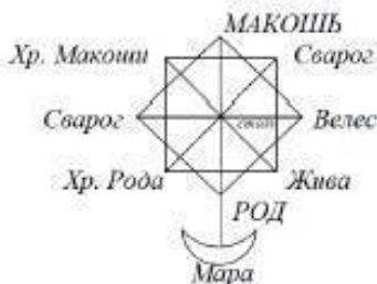
рис. 2 Древняя форма