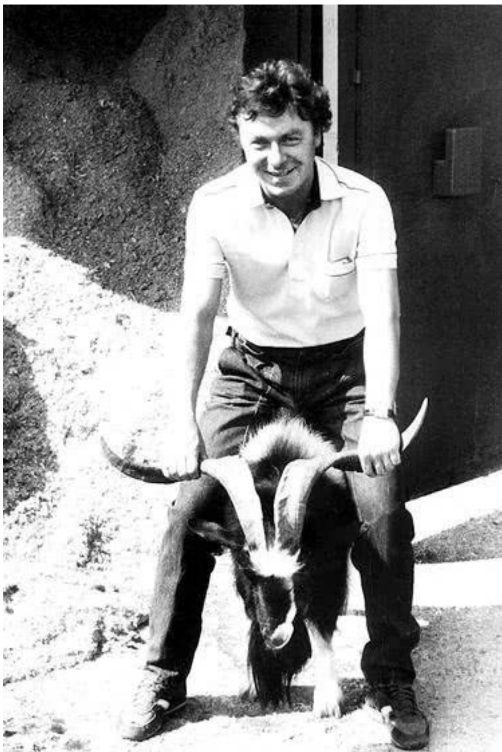
Капитановский очевидным образом пародирует обложку альбома Ram Пола Маккартни