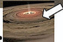
Vista desde el espacio ●

(La flecha indica la ubicación del observador)