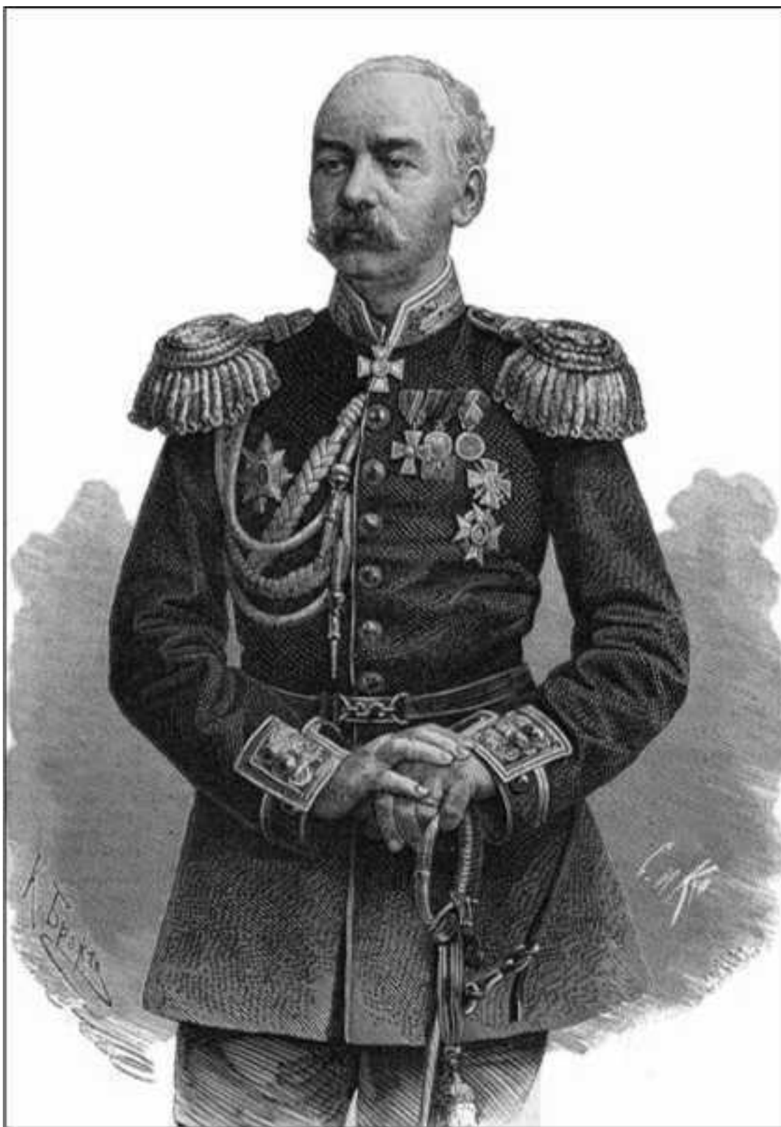
К.П. фон Кауфман

Прибыв в край в ноябре 1867 года, ген. Кауфман, несмотря на волнения в населении, обратил главное внимание на устройство внутреннего управления краем и всеми силами стремился к мирному соглашению с правителями среднеазиатских ханств. По отношению к Кокандскому ханству это удалось вполне. С Худояр-ханом кокандским был заключен договор,