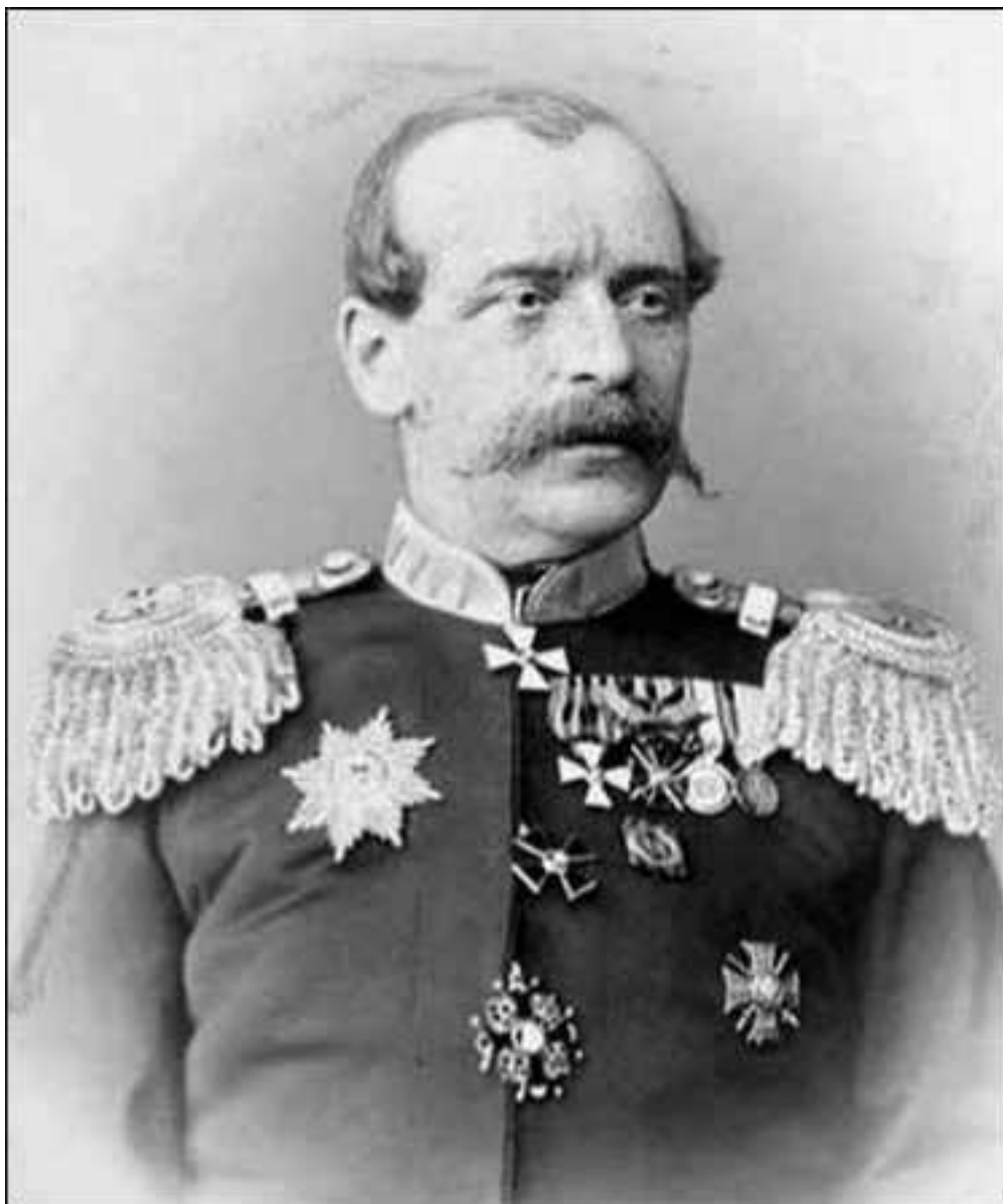
Г. А. Колпаковский

Наши силы, расположенные в то время в г. Верный и его окрестностях (в Алатавском округе), заключались всего в 1000 человек пехоты и казаков, но начальником их был решительный, храбрый и опытный в среднеазиатских делах подполковник Колпаковский 18 . Зная, что в войне с азиатами не столько необходима численность войск, сколько смелость и неожиданность атаки, зная, что, укрывшись за валы укр. Верный, он отдал бы на разграбление неприятеля город и пригородные станицы, только что начавшие образовываться, подполковник Колпаковский быстро собрал 3 роты пехоты, 4 сотни казаков, 6 орудий, двинулся с этим отрядом