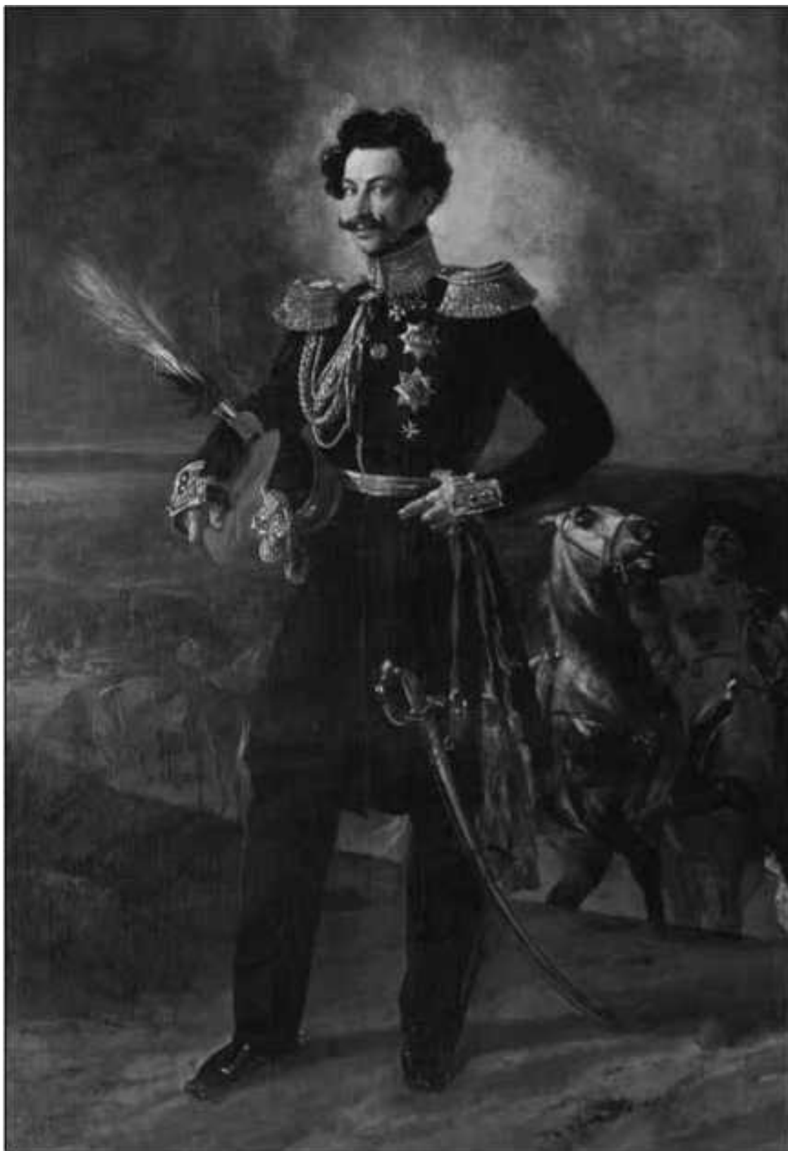
В. А. Перовский

Вместо предположенных 12 000 верблюдов поставлено для найма только 9500. Всего выступило в поход около 4000 человек при 10000 верблюдах. Выступление отряда из Оренбурга произведено 4 эшелонами в начале ноября.