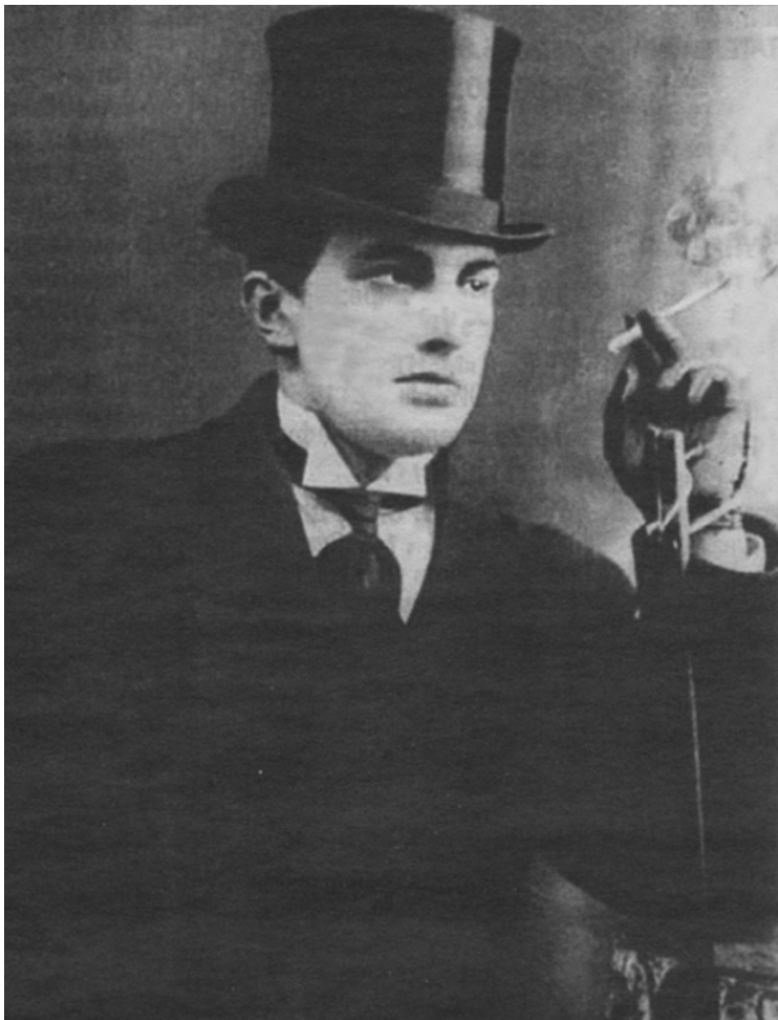
В. В. Маяковский

Роз не будет. Поэт Анатолий Мариенгоф, друг Сергея Есенина и Рюрика Ивнева, был щёголем. Даже в суровые годы Гражданской войны тщательно следил за ногтями рук (это при необходимости топить буржуйку!) – красил их розовым лаком; волосы на голове вызывающе разделял гвардейским (прямым) пробором; ходил в новеньких лакированных ботинках и элегантном костюме. И это на фоне потёртых френчей и галифе, облезлых шуб, вязаных фуфаяк и башлыков.