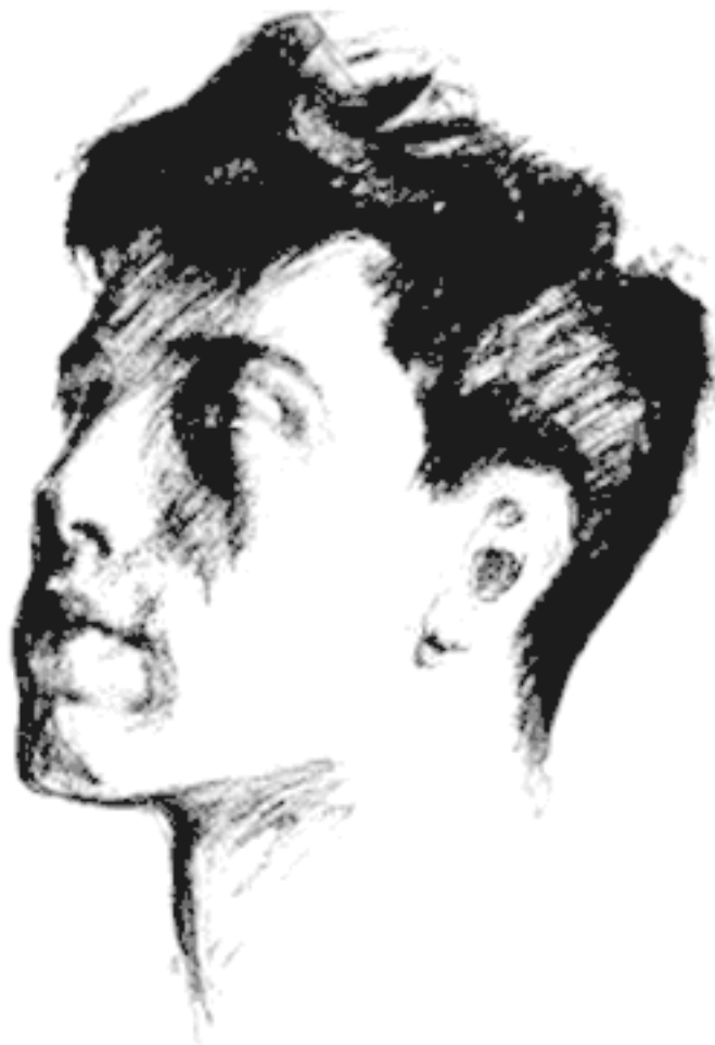
Б. Л. Пастернак