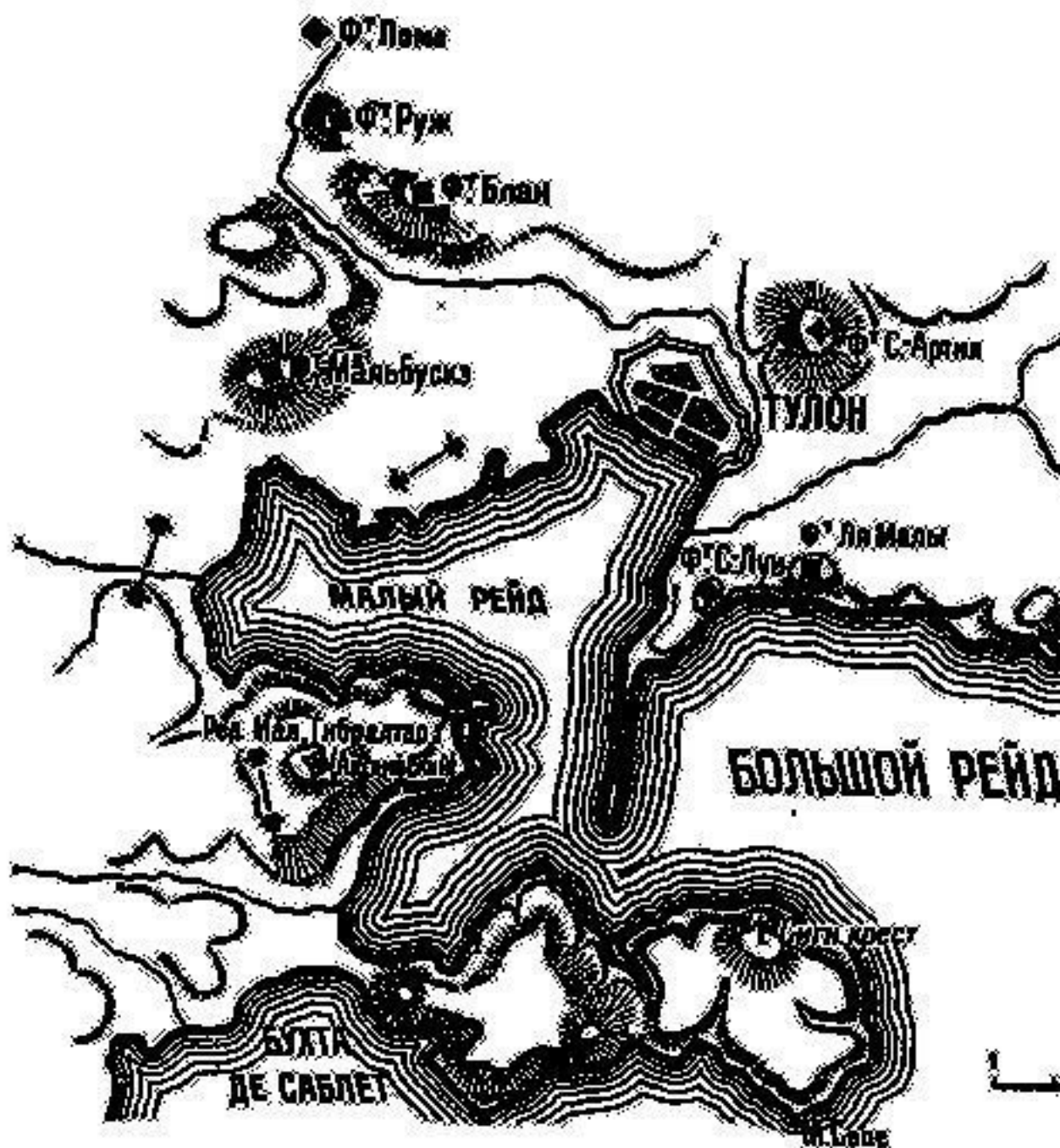
Схема 1. Сражение под Тулоном

14 декабря 45 орудий начали бомбардировку укреплений. Бомбардировка продолжалась три дня, после чего важнейший из редутов «Малый Гибралтар» (редут английский) был взят штурмом в ночь на 18 декабря. Наполеон умело определил географический пункт, овладение которым привело к успешному разрешению задачи в целом. Потеря укреплений на полуострове заставила английскую эскадру очистить рейд, и Тулон был взят.