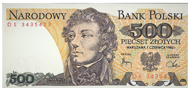
Тадеуш Костюшко на польской банкноте