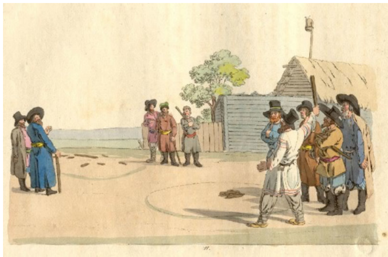
Игра в городки. Вышибание чурок