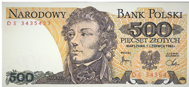
Тадеуш Костюшко на польской банкноте