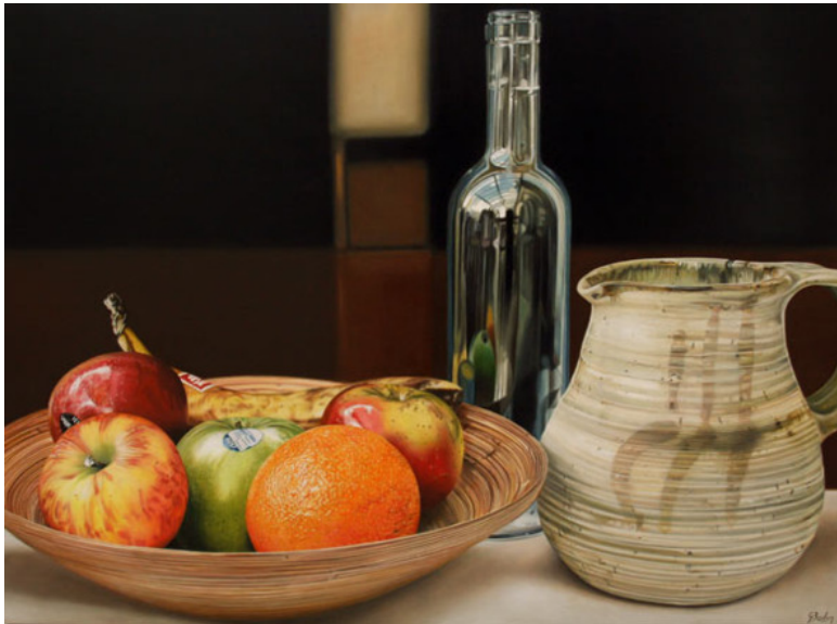
«Фрукты». Жак Боден. 2016 год

И, конечно же, Леон добавил несколько своих работ в данном виде живописи.