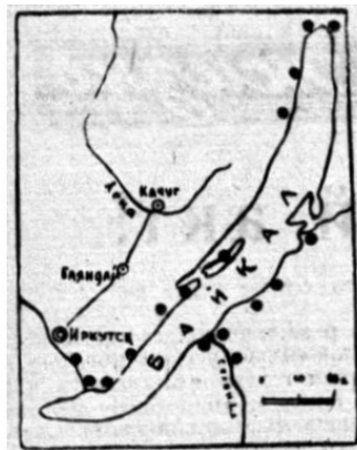
Места находок медных и бронзовых предметов на Байкале.

На побережье Байкала найдены разнообразные орудия труда и предметы быта бронзового века – топоры, ножи, кинжалы, шилья, наконечники стрел, удила, стремяна, браслеты и другие предметы.