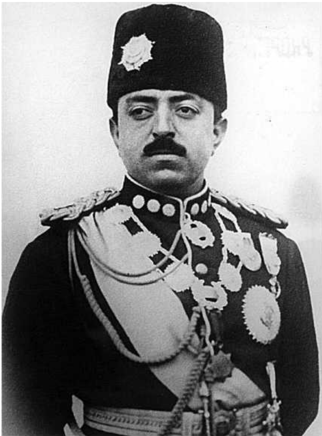
Эмир Афганистана Аманулла-хан

Именно тогда в афганской партии появился новый (хотя, по большому счету, игрок был всем хорошо знаком). Слово «шурави», что в переводе означает «советский», впервые прозвучало в Афганистане вовсе не в 1979 году, когда на территорию ДРА (Демократическая Республика Афганистан) был введен ограниченный контингент, а в далеком 1919 году!