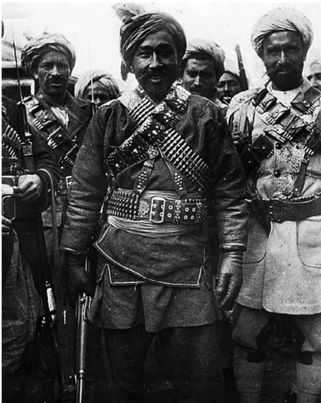
Эмир Хабибулло (Бачаи-Сакао)

Король, Аманулла-хан провел ряд прогрессивных преобразований. Было запрещено рабство, провозглашены неприкосновенность собственности жилища, равенство перед законом и другие гражданские права. Но нововведения не получили поддержки широких слоев населения. Реформы Амануллы-хана способствовали развитию национальной экономики и культуры, укреплению национальной независимости государства. К сожалению, процесс широкой реформации общества, делавшего первые шаги в направлении перехода от феодализма к системе буржуазных отношений, так и не был им завершен.