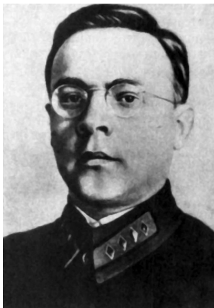
Рагиб-бей, он же – Витмар. Краском Виталий Маркович Примаков возглавивший в 1929 году первый поход РККА в Афганистан

Утром 14 апреля советский отряд перешел границу с Афганистаном. На рассвете разведчики сняли афганскую заставу на южном берегу Амударьи и двинулись на юг. На следующий день отряд достиг города Келиф. Его гарнизон был настроен воинственно, но после первых же пушечных выстрелов и пулеметных очередей сложил оружие.