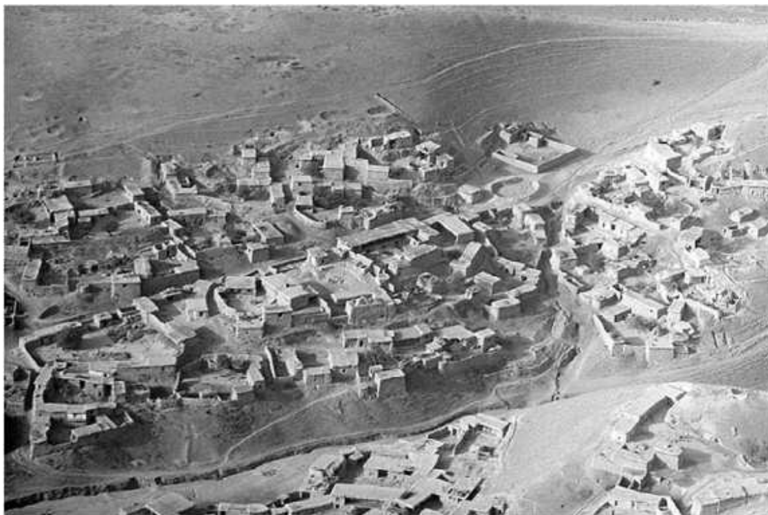
Панорама типичного афганского кишлака

В это же время мы начали получать информацию о появлении банд на подступах к афганскому кишлаку Ишкашим, напротив него находилась 1-я пограничная комендатура 66-го пограничного отряда. Их главной задачей было устранить новую законную власть и уничтожить ее активистов.