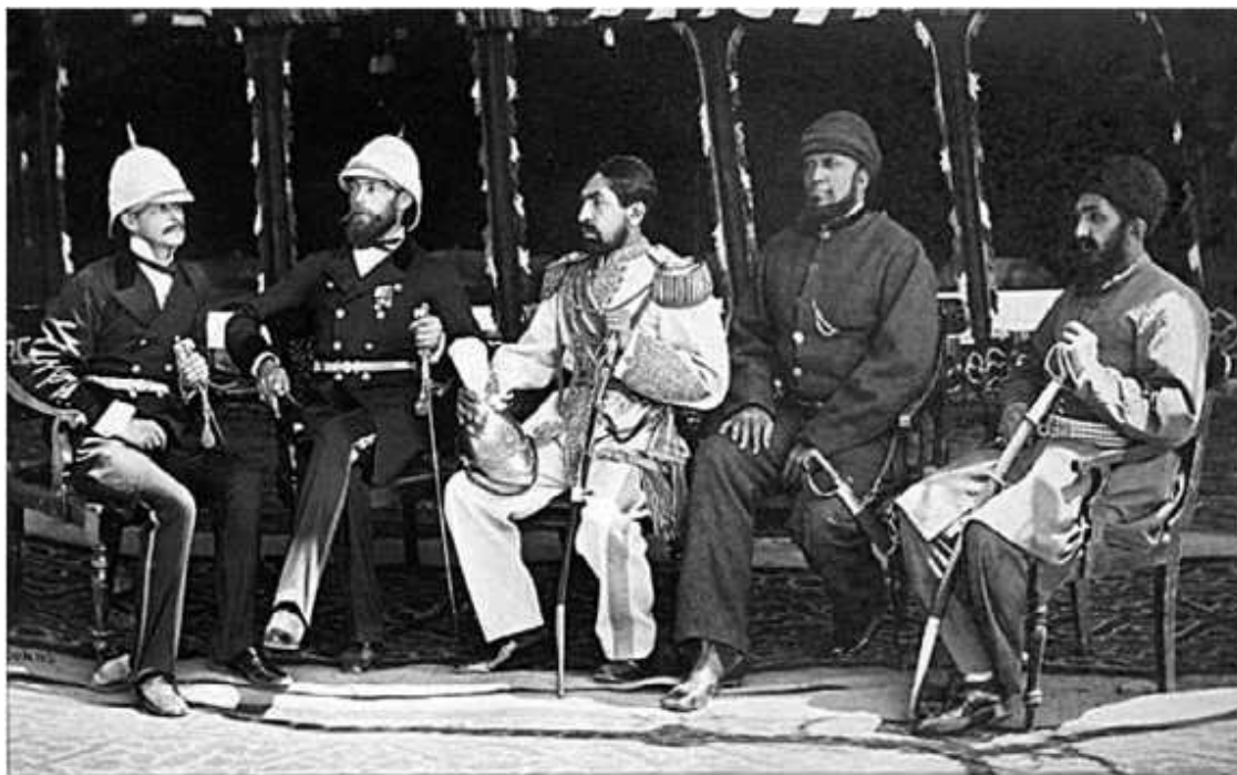
Эмир Афганистана Мухаммед Якуб-хан с британскими офицерами. Май 1879 года

В ответ на это, в стране развернулась антибританская народная война. Войска захватчиков были рассеяны. Из всей армии до Джелалабада удалось добраться лишь одному счастливчику – доктору Брайдону. Английский посол Александр Бернс был разорван на куски толпой в Кабуле. Предпринятая в 1842 году карательная экспедиция закончилась для англичан окончательным разгромом.