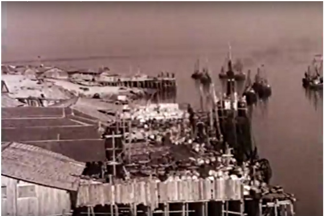
Причалы Шоинского порта. 50-е годы. У "второй базы" стоит пароход с дымящей трубой. В реке мотобота с рыбой, которые ждут разгрузки.

К причалу “второй базы”, в как раз напротив нашего дома, пришвартовывался, приходивший с Архангельска, пароход “Канин”. Была хорошо видна его высокая труба, из которой вырывались клубы черного дыма.