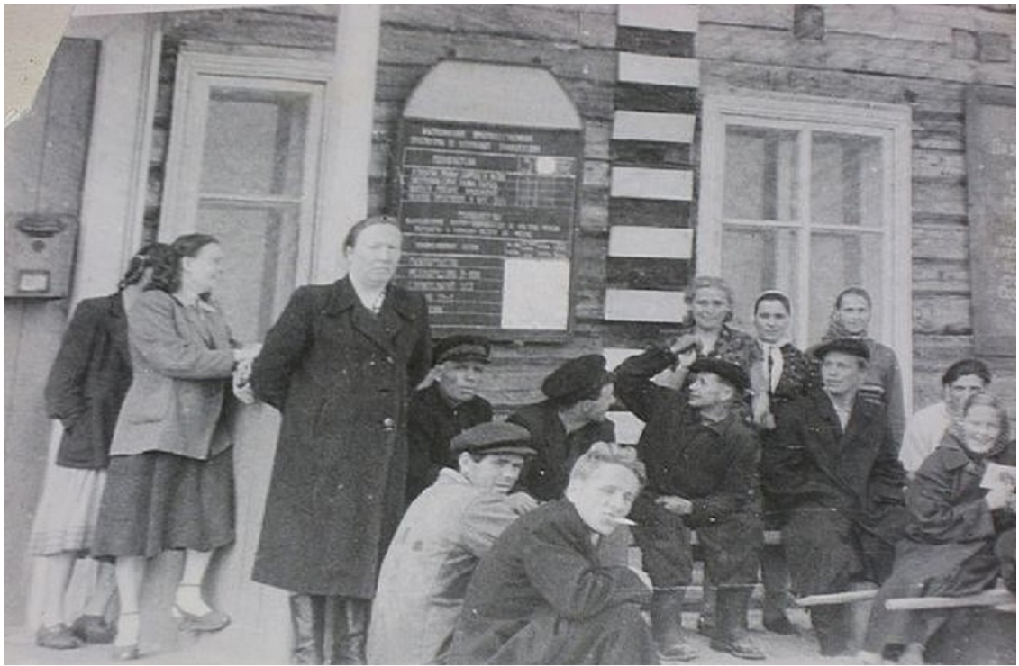
У здания сельсовета в Шойне. 50-е годы