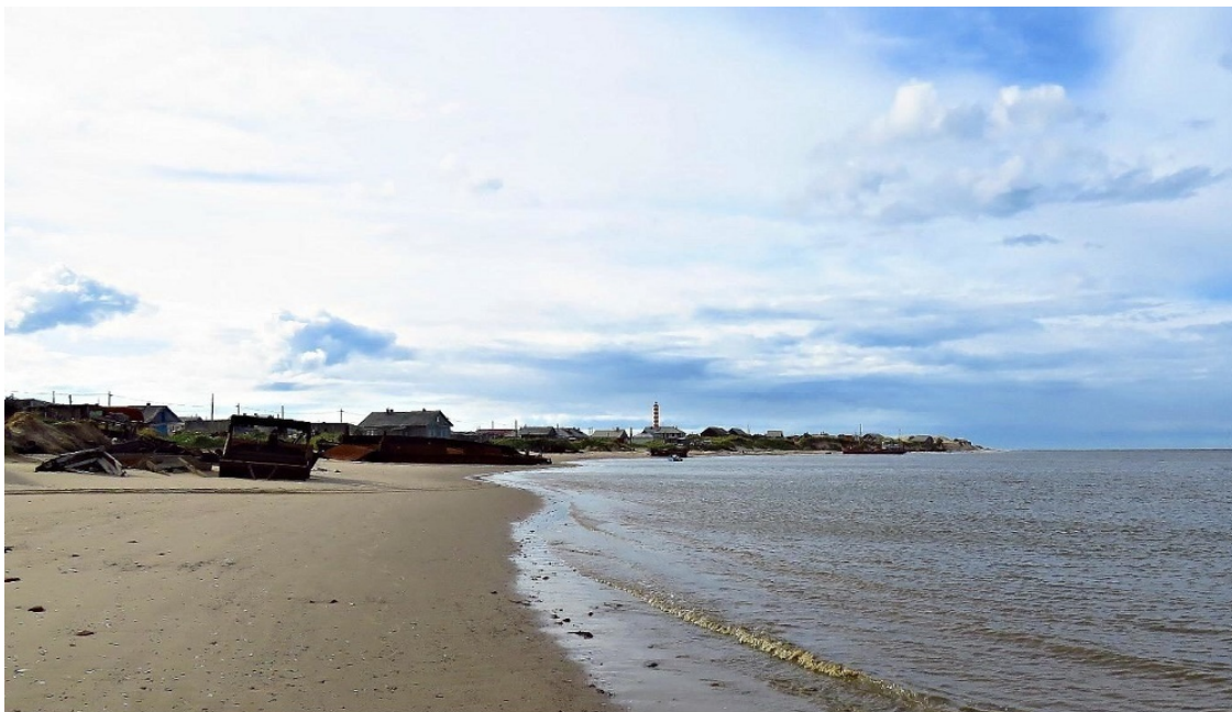
Шойна, полуостров Канин.

Родина... Родина... тропы олены... Родина – в сопках родное селенье.