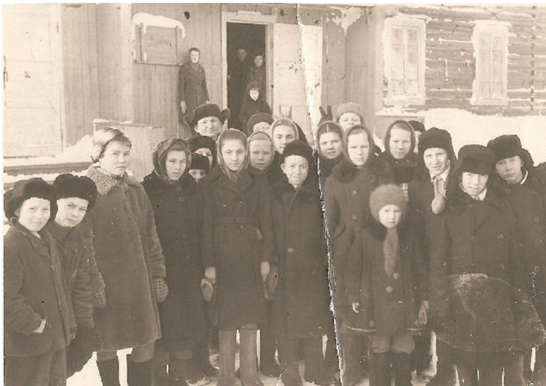
Дети Шойны 50-х годов возле клуба, среди них много моих одноклассников