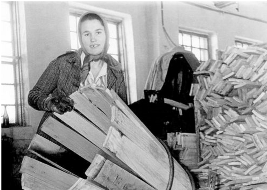
Бандарный цех, где изготавливали бочки под рыбпродукцию