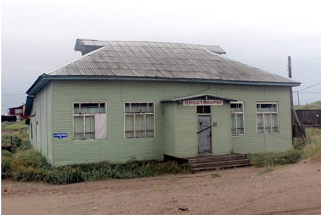
Здание магазина. Построено ещё до войны