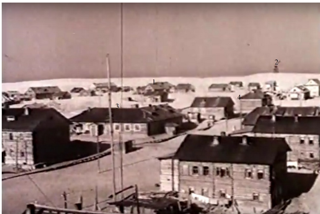
Шойна в начале 50-х годов. 1 - наш дом, 2 - маяк, 3 - столовая, 4 - продовольственный магазин

Моё первое знакомство с посёлком, в те годы становищем, Шойна, происходило летом 1948 года, когда меня в возрасте двух лет мать привезла сюда морем из поморской деревни Койда, что в Мезенском районе. Воспоминания тех далёких лет, конечно, очень туманны и не полны. И лет было маловато, да и период времени уже прошёл большой. И всё же кое-что я помню, в том числе и из рассказов моих родных.