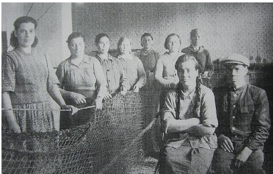
В сетевязке. Начало 50-х годов