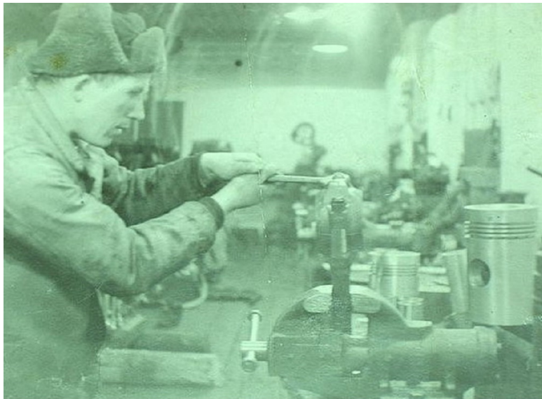
В слесарных мастерских