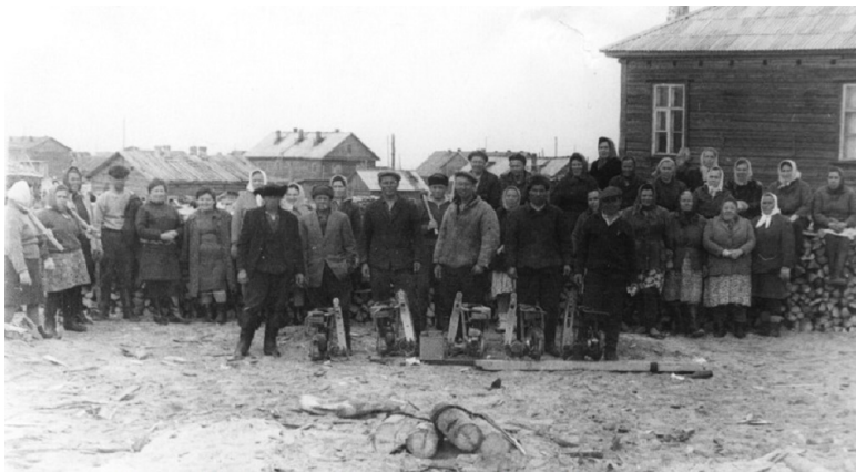
Жители Шойны на субботнике.

Эту книгу я посвящаю нынешним и бывшим жителям заполярного посёлка Шойна – полуостров Канин, Архангельская область. Сам я прожил здесь более тридцати лет. На моих глазах происходили события конца сороковых, пятидесятих годов – расцвет Шойны. В те годы в этом рыбацком посёлке находилась база флота рыболовецких колхозов Архангельской области.