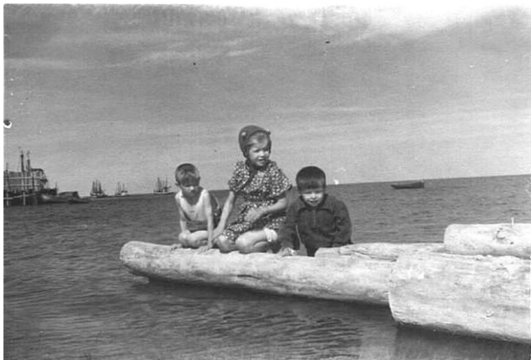
Шойна нашего детства

В течение нескольких лет я по крупицам собирал материалы о Шойне. Поехать в посёлок, чтобы поговорить со старожилками, уже не позволяло здоровье, да и людей тех, кто мог бы рассказать мне что-то новое уже почти не осталось. Поэтому главными моими помощниками были моя память и интернет.