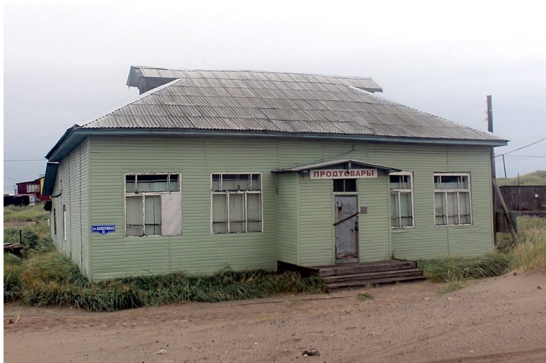
Здание магазина. Построено ещё до войны