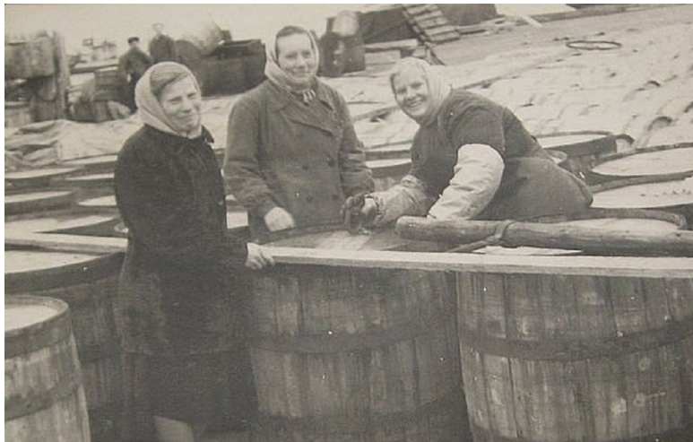
Затаривание рыбы в 200-литровые бочки на базе в Шойне

На рейде в районе Шойны в ожидании разгрузки выловленной в море продукции одновременно стояло несколько десятков рыболовецких судов. В летний период разгрузка с этих судов на базах рыбозавода происходила круглосуточно. Морскими судами на базу поставлялась выловленная в районе полуострова Канин треска, пикша, другие породы рыб и даже акулы.