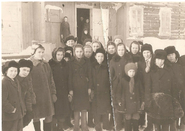
Дети Шойны 50-х годов возле клуба, среди них много моих одноклассников