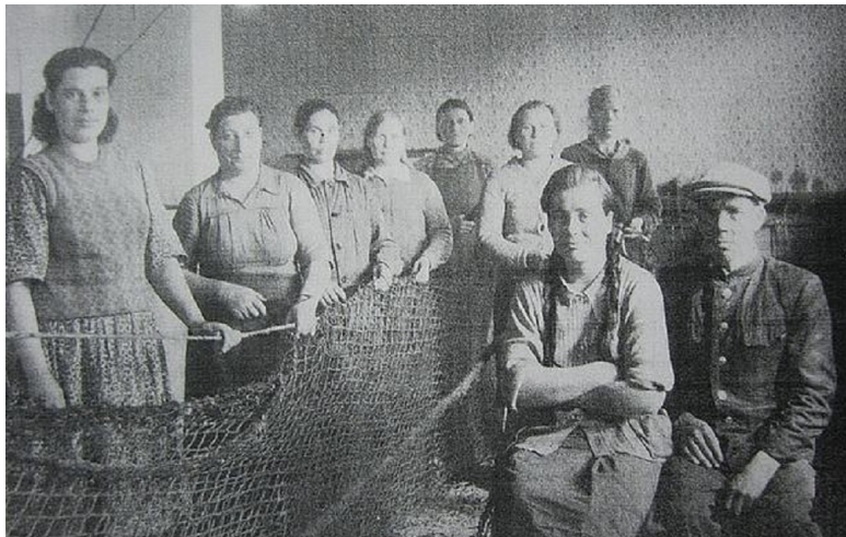
В сетевязке. Начало 50-х годов