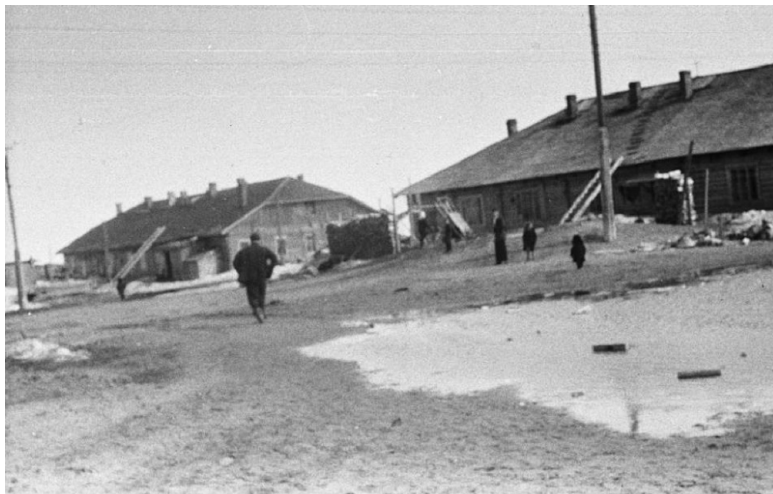
Шестой и седьмой бараки в Шойне