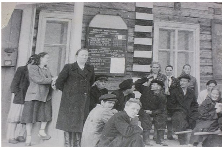
У здания сельсовета в Шойне. 50-е годы

Будучи еще детьми, мы бегали по построенному фундаменту здания, играли. В первые годы здесь размещались какие-то конторские организации рыбозавода и радиостанция тралфлота. Затем сюда перевели Сельский Совет.