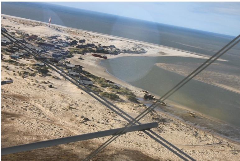
Посёлок Шойна, река и море

“Пошли рыбачить на носок” – так говорили шоинские ребята друг другу, собираясь на рыбалку.