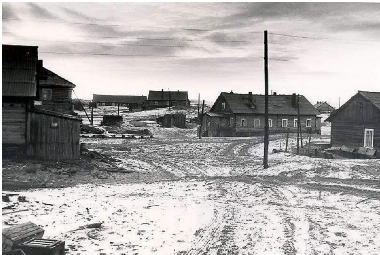
Наш дом на горке. Снимок сделан со стороны берега реки.

на первом этаже этого дома. Пограничники к тому времени переехали в другое здание.