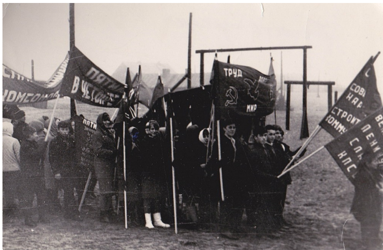
Колонна школьников готовится к демонстрации

Помню майские демонстрации. Собирались работники рыбокомбината у своего административного здания, конторы. Работники других многочисленных организаций поселка возле здания сельского Совета. Учащиеся и работники школы в районе зданий школы и интерната. Затем все объединялись в одну колонну. Колонна была украшена транспарантами и флагами. В репродукторах звучала праздничная музыка. Шли по поселку обычно по улице, где были расположены здания больницы, школы, рыбокооп в сторону моря до конца улицы и обратно. Май, весна. После длительной и суровой зимы это особенно поднимало настроение людей. Для