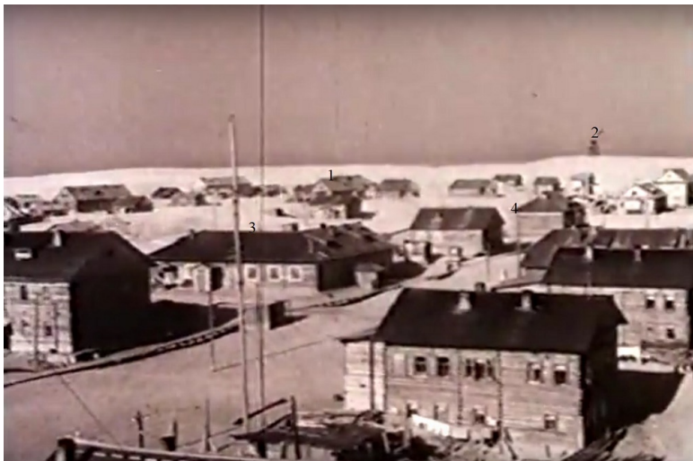
Шойна в начале 50-х годов. 1 - наш дом, 2 - маяк, 3 - столовая, 4 - продовольственный магазин

Моё первое знакомство с посёлком, в те годы становищем, Шойна, происходило летом 1948 года, когда меня в возрасте двух лет мать привезла сюда морем из поморской деревни Койда, что в Мезенском районе. Воспоминания тех далёких лет, конечно, очень туманны и не полны. И лет было малова-то, да и период времени уже прошёл большой. И всё же кое-что я помню, в том числе и из рассказов моих родных.