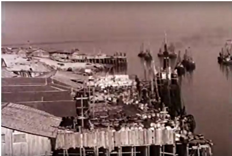
Причалы Шоинского порта. 50-е годы. У "второй базы" стоит пароход с дымящей трубой. В реке мотобота с рыбой, которые ждут разгрузки.

К причалу “второй базы”, в как раз напротив нашего дома, пришвартовывался, пришедший с Архангельска, пароход “Канин”. Была хорошо видна его высокая труба, из которой вырывались клубы черного дыма.