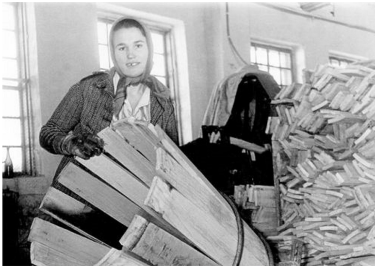
Бандарный цех, где изготовляли бочки под рыбпродукцию