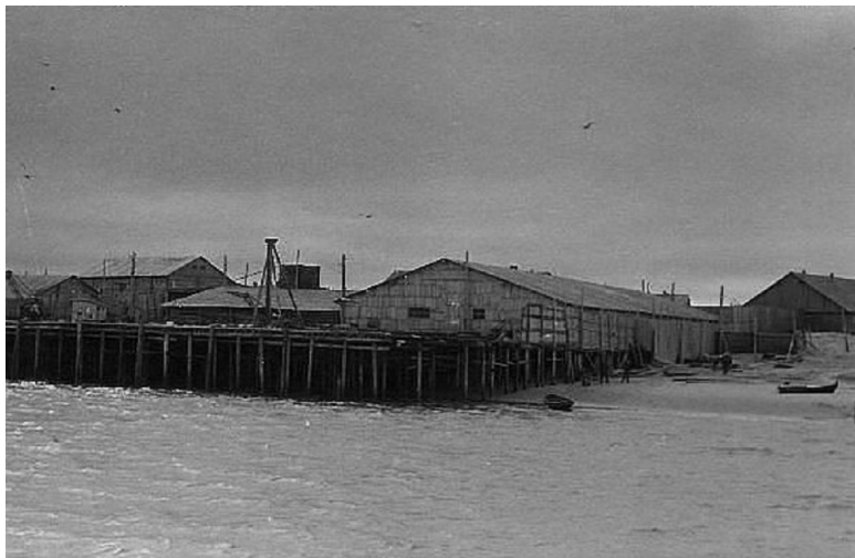
Вторая рыбообрабатывающая база в Шойне.

Какие же предприятия и организации были в те годы в нашем далёком заполярном посёлке Шойна?