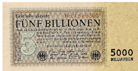
Cinque trilioni di marchi «cartacei» nel 1923Cinque trilioni di marchi «cartacei» nel 1923