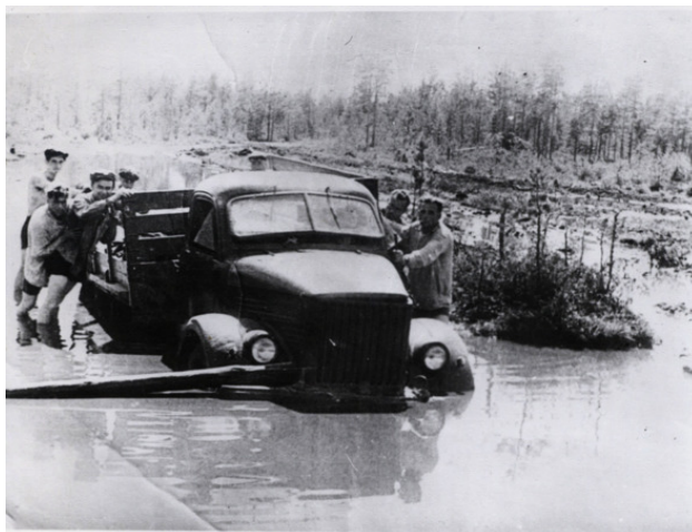
По дороге на работу. 1960-ые.

Несоразмерность города северным условиям чувствовалась всегда. Нефтедобытчикам и энергетикам всегда чего-то не хватало. При этом перед приезжими подчеркивался масштаб города. «Это же Сургут, неофициальная столица нефтяного края».