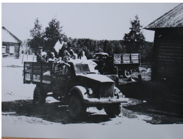
Один из сургутских переездов. 1960-ые годы.

За два-три дня командировки или недельной поездки к друзьям-родным редко удается ухватить суть происходящего в городе, понять его характер, узнать о событиях или людях, которые повлияли на облик и историю места. Приезжаем, впечатляемся, забираем с собой теплоту встреч и рюкзаки сувениров и торопимся дальше. А ведь так порой хочется разгадать город. Нет? А мне, например, всегда интересно увидеть большее, чем набор картинок из журнала про путешествия. Но не для пополнения победного списка, а чтобы разобраться со своими стенами и закоулками, обратить внимание на то, чему раньше и значения не придавал. Получить ключи от дверей смыслов и тенденций, образов и перспектив. За годы жизни в Сургуте, во время общения со старожилами такие ключи, на мой взгляд, были найдены. Хотя местные могут и не согласиться. Если знают другие ответы – пусть поделятся. Я делюсь своими.