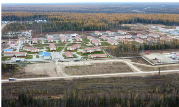
Вахтовый городок компании «Сургутнефтегаз» на Талаканском месторождении (Якутия)