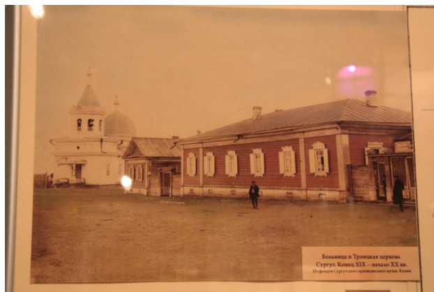
Сургут в к. XIXв. Экспозиция Сургутского краеведческого музея.