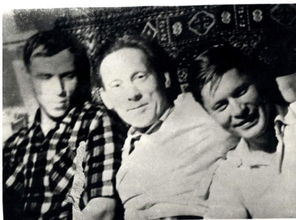
Сургутские геологи, 1960-ые.

неудобств добавлялся комариный писк (ходить без березовой веточки, а порой и накомарника летом в 1967—1979 годы было очень сложно). Если добирались зимой, то это, конечно, морозы. В первые нефтяные годы, по воспоминаниям старожилов, они были особенно лютые, с затяжными периодами, когда на улице было минус 40—45. Проверку проходили далеко не все. Уезжали через год или два, намыкавшись по съемным квартирам, «бочкам» или общежитиям, или через десять, взяв от северного города все что хотели, но расплатившись здоровьем и юностью. Остававшиеся, если приглядеться, были схожи, имели общие черты характера и привычки. Немногословность (при умении очень быстро и четко излагать свои мысли), основательность, отзывчивость, щедрый характер, авантюризм и ответственность, невероятный оптимизм и деловая хватка. Это помогло в «свободные» 90-е годы многим создать свой бизнес и в целом быстро войти в режим рыночных отношений. До сих пор нет-нет да кто-нибудь из таксистов расскажет гостям города, что в 1960—1980-е годы в морозы на трассе помогали водителям сломанных машин, редким пешеходам. Есть рассказы и о радушном приеме родственников и друзей в скромных квартирах, об умении доставать любые вещи в эпоху советского дефицита и лихих путешествиях в выходные в Ташкент за дынями или за пивом в Свердловск.