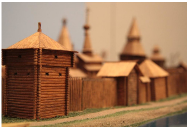
Макет Сургутского острога. Фото автора