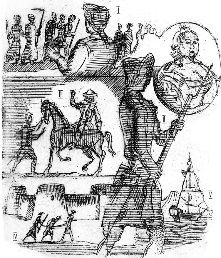
Летом 1749 года Бутырский пехотный полк был расквар-