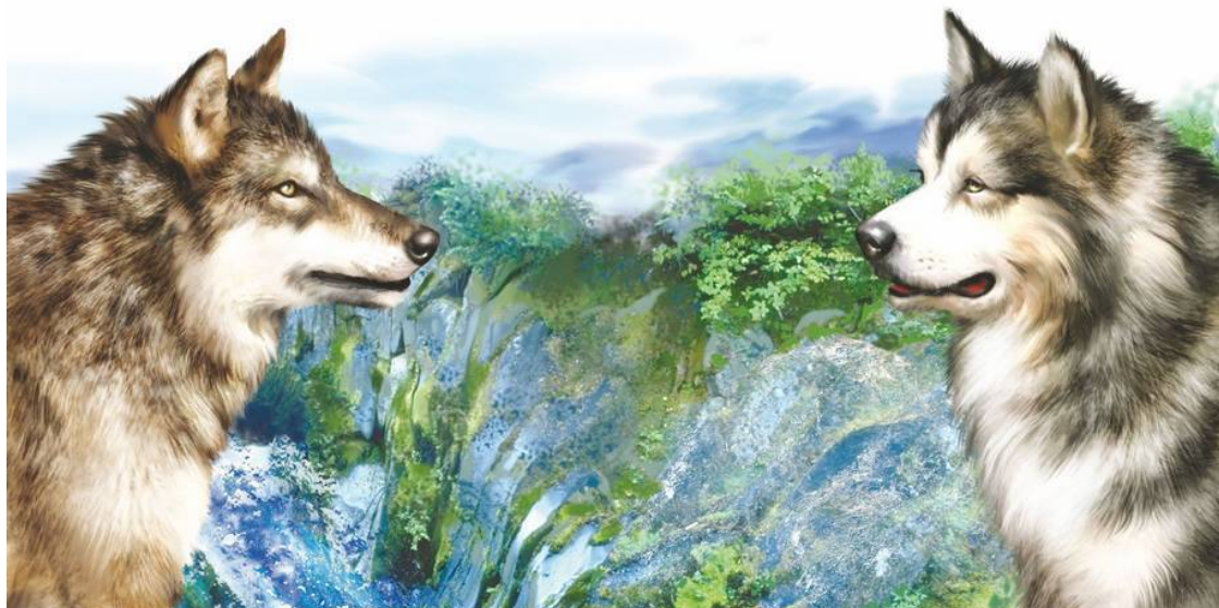
Волк (слева) и аляскинский маламут

Могло быть и так. Ясно одно, волк и человек могли найти «общий язык». Недаром именно волчьи стаи принимали и воспитывали оказавшихся в лесу человеческих детенышей.