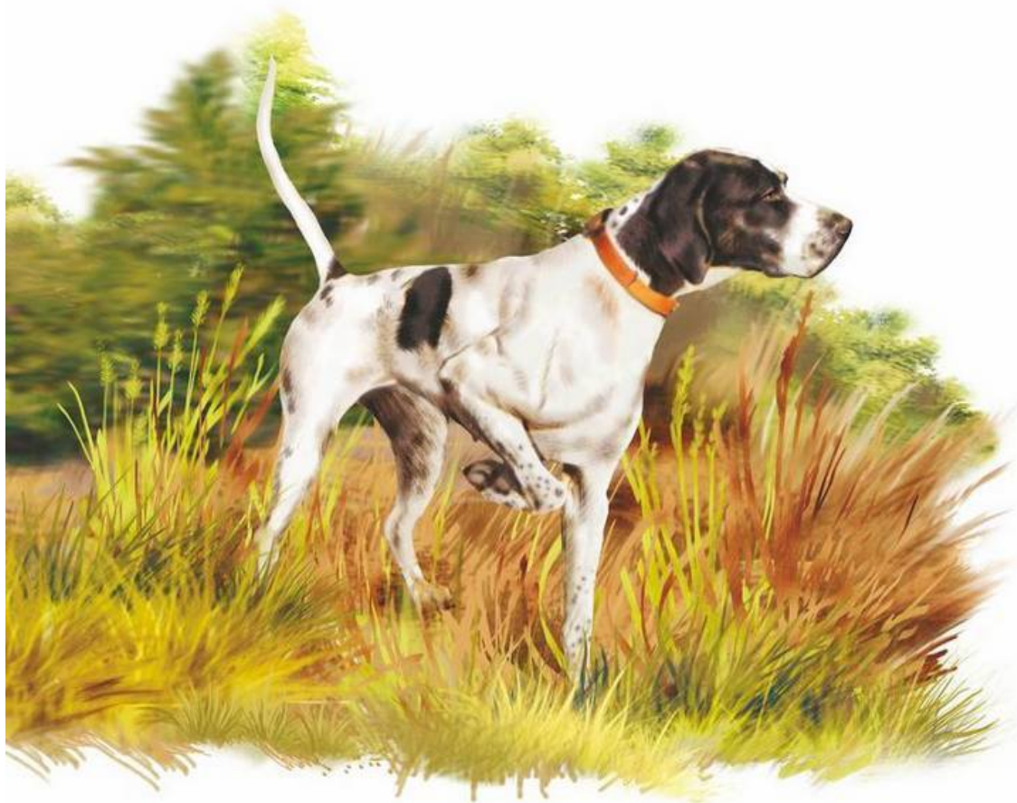
Пойнтер в стойке

Человек развивался. Вот уже вместо палицы он использует на охоте лук и стрелы, и собаки по следу помогают найти подраненную дичь. Вот уже появились и другие прирученные животные, и собака помогает пасти их и защищать от хищников. Теперь на собаку уже не смотрят как на живой резервный запас пищи, теперь она помощник при добывании пищи.