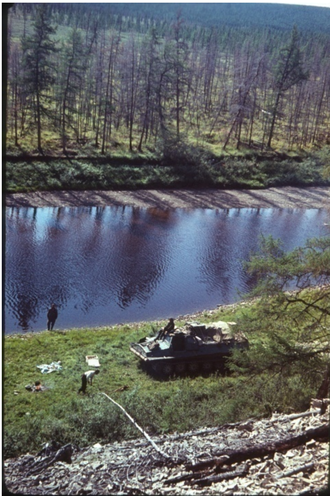
Стоянка у реки