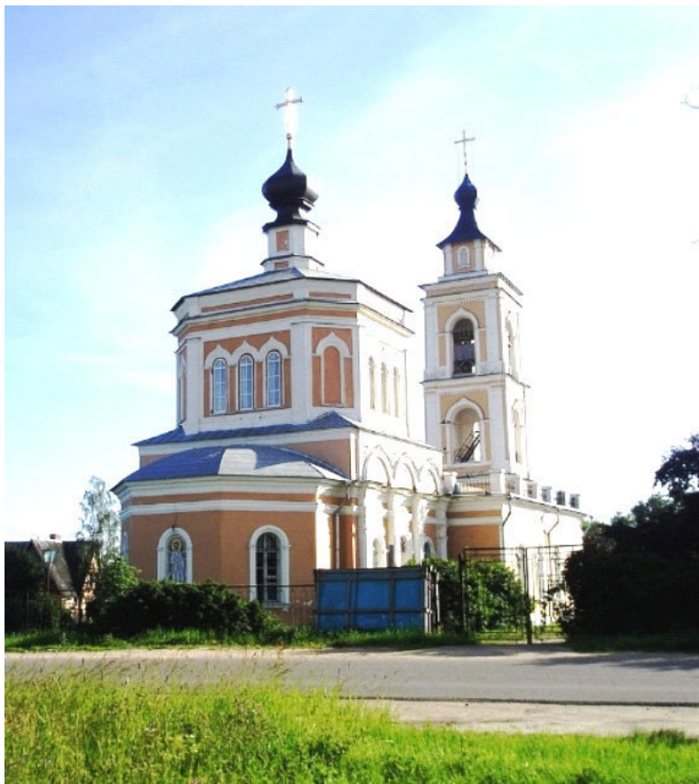
Село Вельяминово Восстановленная Церковь Преображения