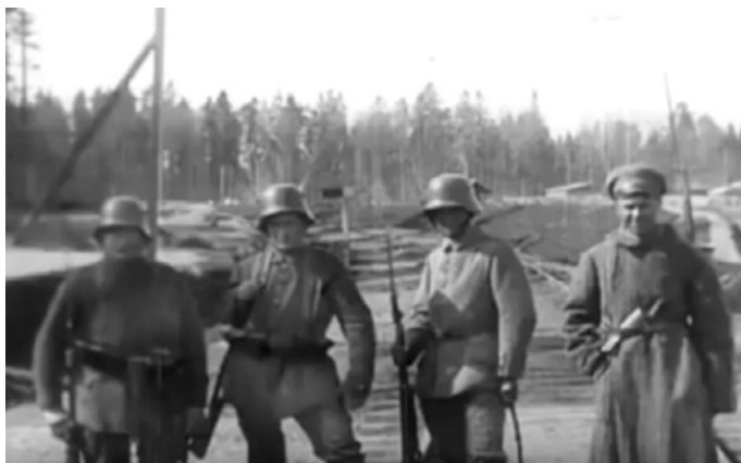
Немецкий и русский пограничный патруль на демаркационной линии в г. Орша, весна 1918 г.