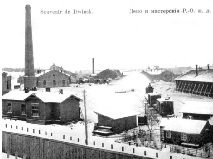
Железнодорожные мастерские г. Двинска. Фото начала XX века. Здесь был изготовлен бронепоезд отряда «1-й Боевой поезд» Ревякина.

Уже начиная с 26 октября, реальная власть в органах управления 5-й армии перешла под контроль большевиков и созданных ими военно-революционным комитетов. Председатель армейского ревкома А. И. Седякин сообщил 5 ноября в ЦК РСДРП(б): «На месте в V армии вся власть в наших руках. Комиссар армии и оба его помощника наши. В каждом резервном полку изготовлен один батальон на случай выступления в помощь вам. . . Если вам теперь понадобится помощь, то через 24 часа после радиограммы наш отряд будет под Петроградом, под Смоленском, в Великих Луках, где хотите». На IV Чрезвычайном съезде солдатских депутатов 5-й армии, проходившем в Двинске 18–20 ноября под председательством члена Двинского комитета РСДРП (б) и председателя армейского комитета штабс-капитана Э. М. Скланского, присутствовало 370 большевиков, 60 эсеров и 10 меньшевиков. Между тем, настроение солдатских масс, как в 5-й армии, так и на других фронтах, становится все более неуправляемым.