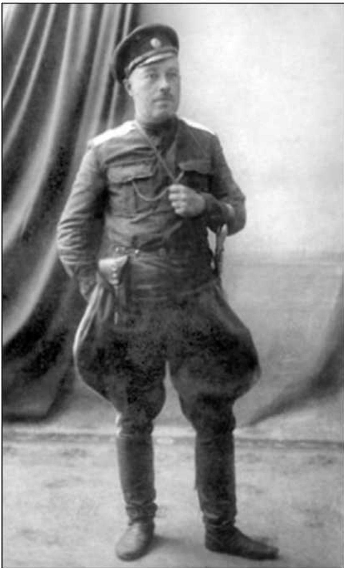
Войсковой Атаман полковник Дутов. Фото 1917 г.