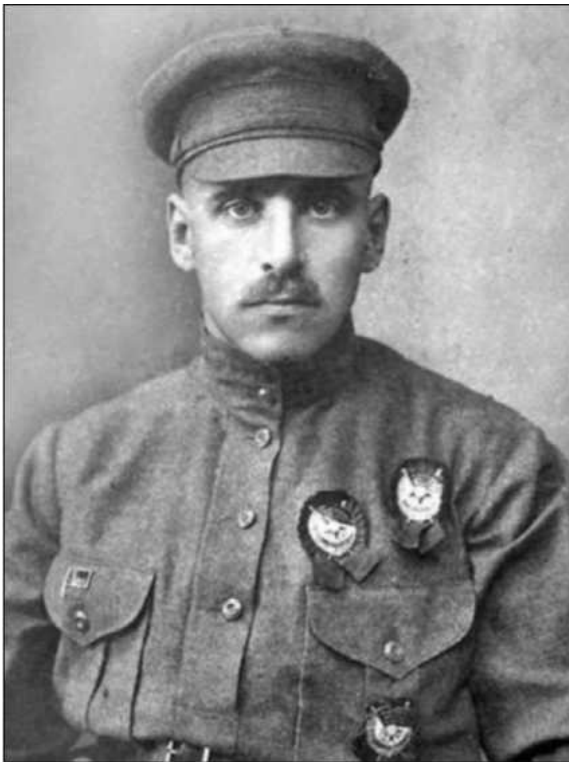
В. К. Блюхер. Фото 1923 г.

бург был сдан 31 января 1918 года. Сам Дутов в сопровождении шести офицеров ушел в сторону Верхнеуральска. Позже в Верхнеуральске соберется Оренбургское войсковое правительство и будет сформирован небольшой партизанский казачий отряд. В конце марта, после захвата Верхнеуральска отрядами Каширина и Блюхера, атаман Дутов с отрядом уйдет в станцию Краснинскую, а затем в Тургайские степи на территорию Казахстана, где приступит к формированию отрядов и созданию войска.