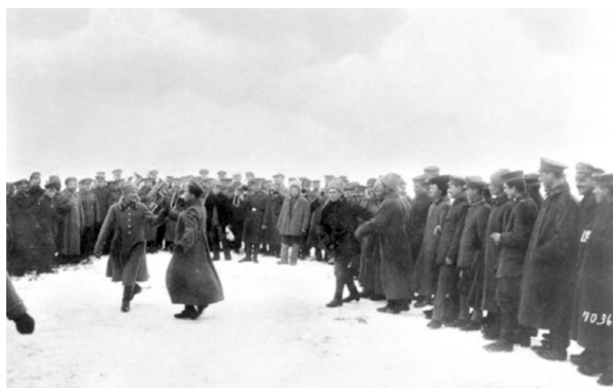
Сцена братания с противником в 5-й Армии. Зима 1917–1918 г.

Едва дойдя до немецких позиций, русские полки повернули обратно и отказались выполнять дальнейшие приказания. Исключение составляли отдельные ударные «батальоны смерти», созданные по инициативе Временного правительства из добровольцев. Были разоружены и заключены под стражу в Двинскую крепость около 12 тысяч солдат и офицеров мятежных полков. Зачинщики и активисты, как правило, члены солдатских комитетов, в числе 890 человек были отправлены в Москву и заключены в Бутырскую тюрьму. Впоследствии все они стали активными участниками вооруженного восстания в Москве в октябре 1917 года и вошли в историю под названием «двинцы».