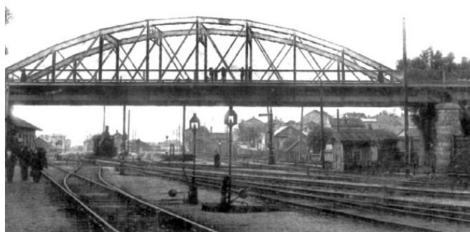
№ 152. Souvenir de Dwinsk. Viaduc P. O. ж. д.