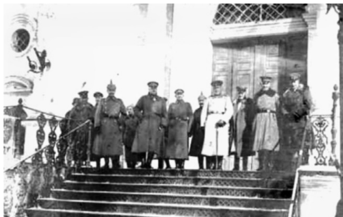
Представители германского командования перед собором г. Двинска 18 февраля 1918 г.