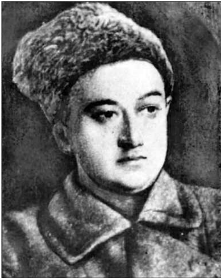
Г. В. Зиновьев, фото начального периода Гражданской войны.