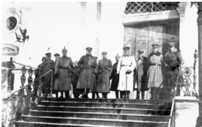
Представители германского командования перед собором