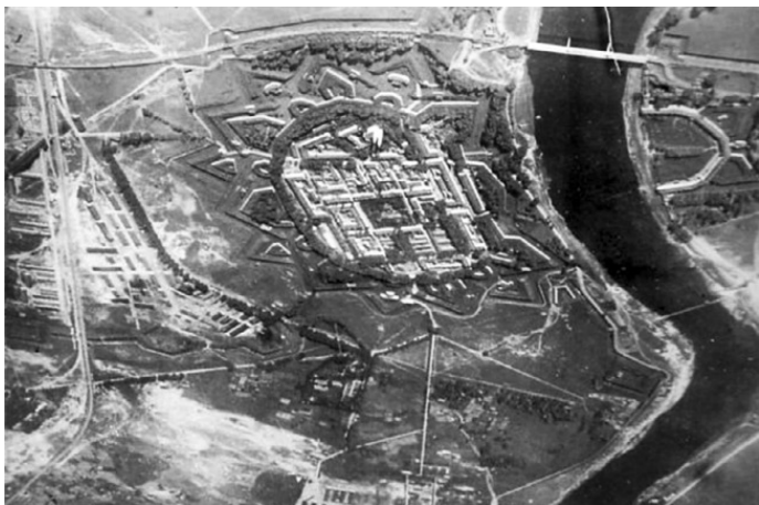
Крепость Двинск. Фото с германского цеппелина. 1917 г.

Отряду были приданы три железнодорожных состава, насчитывающие семь классных пассажирских вагонов для личного состава, товарные вагоны с боеприпасами, две платформы с легкими пулеметными бронемашинами и две платформы с трехдюймовыми орудиями. Один эшелон был вспомогательный. В нем находилась хозяйственная часть, три автомобиля (два грузовых и легковой), лошади, обоз и горючее. Все классные вагоны имели по четыре специальных пулеметных стола, расположенных в концах вагонов. Командиром и одновременно комиссаром отряда на общем собра-