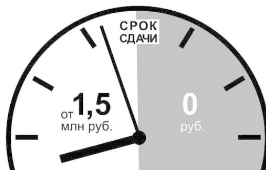
Рис. 2.2. Жесткие обязательства, которые берет на себя строительная компания в отношении сроков сдачи дома в эксплуатацию

Его реклама гласила: «Не достроим вовремя – квартира бесплатно». Оцените красоту игры (рис. 2.2)!