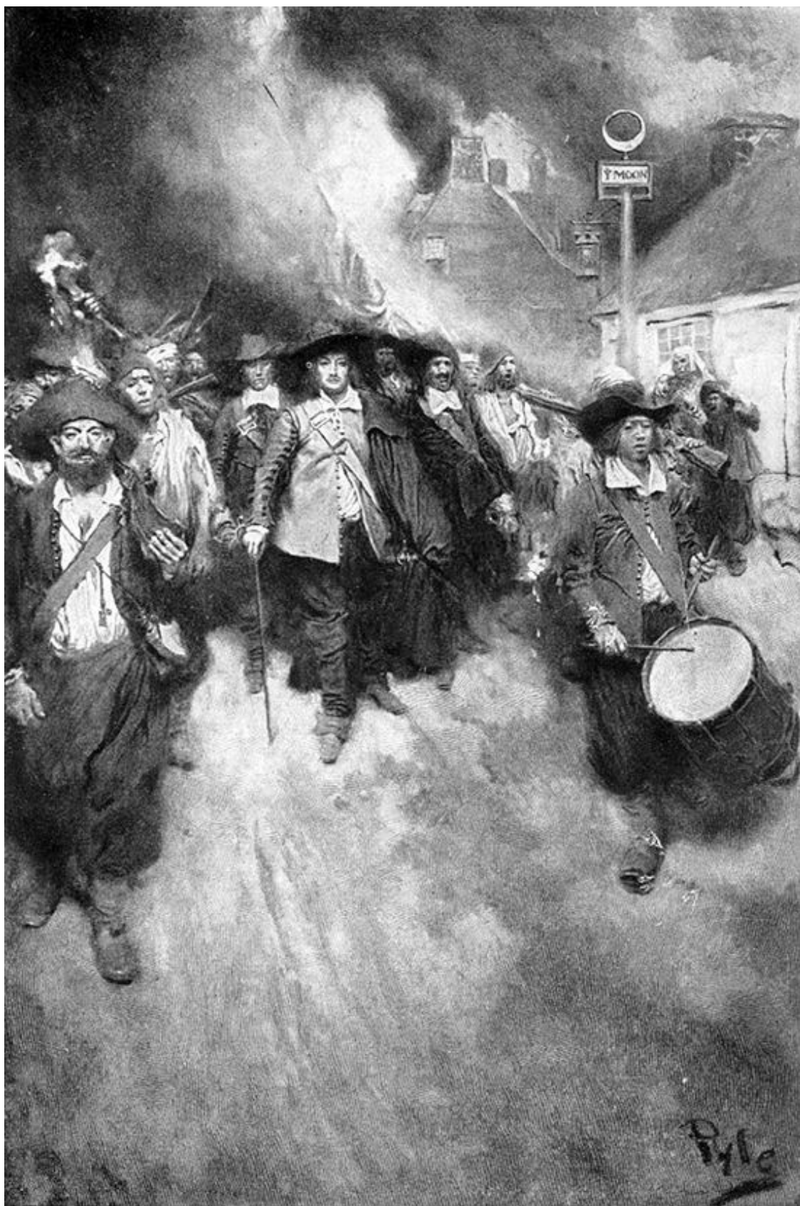
Сожжение Джеймстауна. Худ. Говард Пайл (1905)

В то же самое время в Виргинии разразилось «восстание Натаниэла Бэкона». Возглавляемые плантатором Бэконом жители приграничных территорий начали военные действия про-