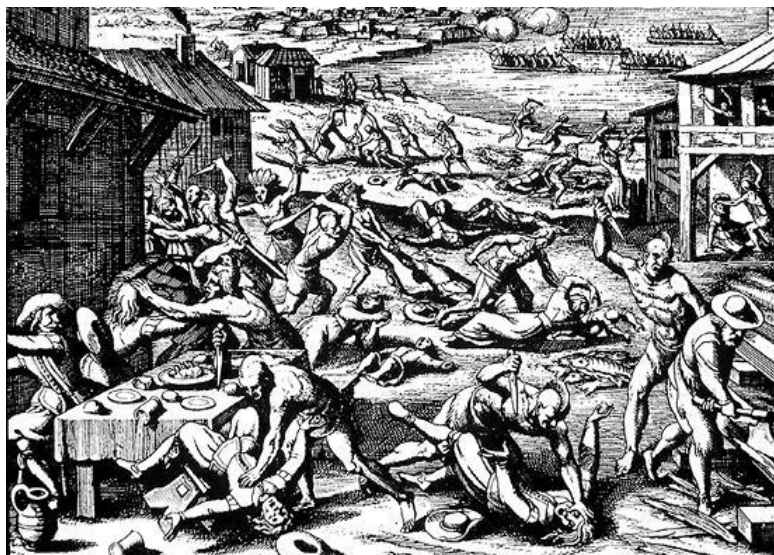
Нападение индейцев на Джеймстаун в 1622 году