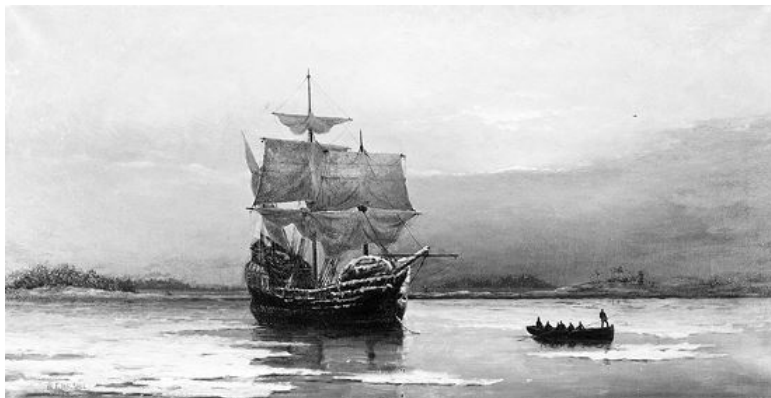
Корабль «Мейфлауэр», который в 1620 году привез