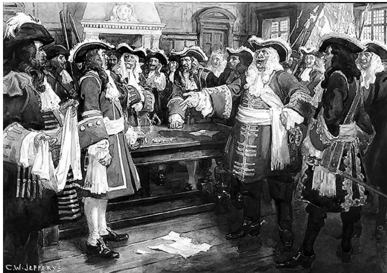
Граф де Фронтенак принимает британского посланника Уильяма Финса с требованием о капитуляции Квебека. Худ. Чарльз Уильям Джефрис (1925)

В июне 1689 года несколько сотен индейцев из племен абенаки и пеннакуки совершили набег на Довер, убив свыше 20 человек и захватив 29 пленников, которые были проданы во французскую колонию Новая Франция. В августе 1689 года французский офицер Жан-Венсан д'Аббади де Сен-Кастен, чей дом был разграблен в ходе рейда губернатора Эндрюса, повел отряд индейцев племени абенаки набегом на Пемаквид (нынешний Бристоль в штате Мэн). В ответ преуспева-