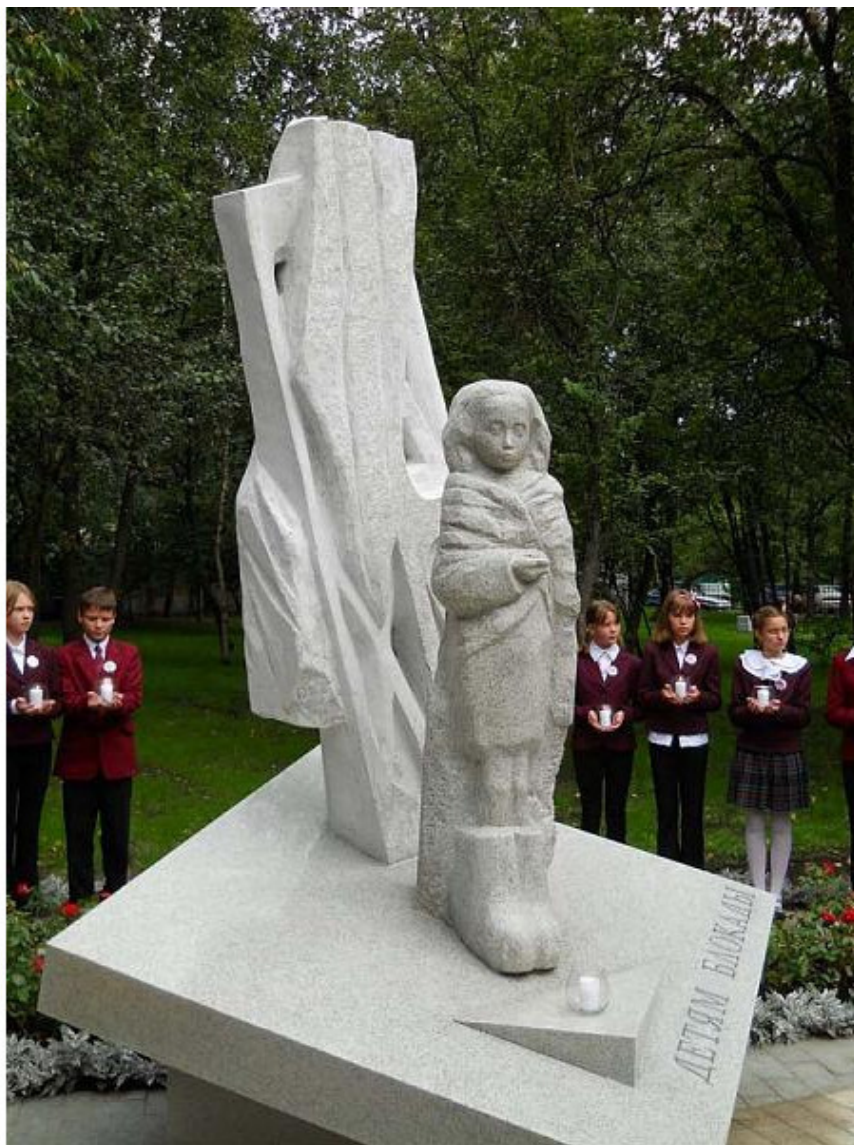
Памятник детям блокадного Ленинграда. Санкт-Петербург

Губернатор Матвиенко, выступая на открытие памятника, сказала: