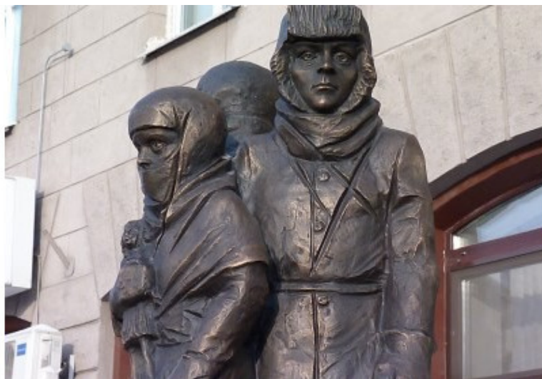
Памятник детям Ленинграда в Омске

Это удивительно, что во многих местах, даже очень удалённых от Ленинграда, возведены памятники в честь прекрасных несчастных детей Ленинграда.