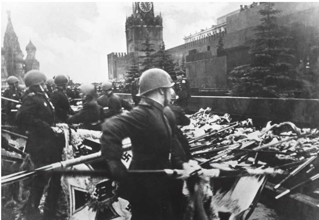
Немецкие военные знамена и штандарты – к подножию Мавзолея Ленина, 1945 год

Может, устроители парадов 9 мая в Москве и других городах в честь Победы, веря им, не упоминают на этих парадах ни одного командующего фронтом, не говоря уже о Верховном Главнокомандующем. А о том, как поверженные фашистские знамена бросали к подножию Мавзолея на Параде Победы, стараются вымарать из исторической памяти людей, пряча от участников и гостей парадов это историческое место декоративной фанерой, будто какое-то стыдное место. Получают установки и специалисты, организующие с Красной площади трансляции любых торжеств, чтобы Ленинский мавзолей не попал в объективы телекамер.