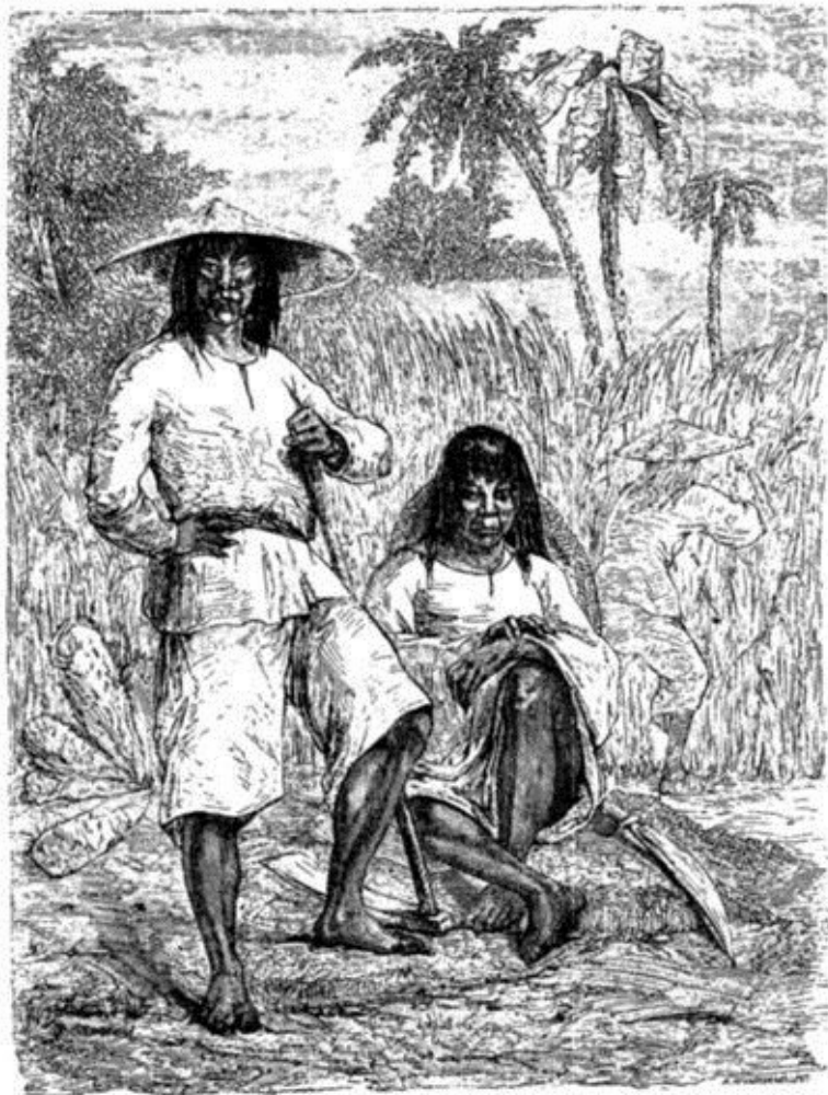
Coolies chinois, à Cuba.—Dessin de Pelcoq d'après une