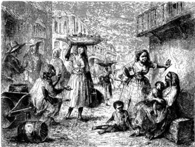
Habitants de la Havane.—Dessin de Pottin.