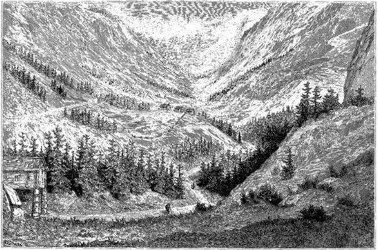
La vallée de Vestfjordal.—Dessin de Doré d'après M. Riant.

Au bout d'une autre heure, les pentes s'adoucissent et l'on entre dans une vaste prairie traversée par une petite rivière et bordée de hautes collines: c'est le sæter de Moën. Rien en général n'est tranquille et poétique comme un sæter ; c'est une petite ferme isolée, inhabitée l'hiver. Là, en été, une famille, quelquefois une jeune fille seule, garde dans les pâturages de la montagne des troupeaux de moutons et de vaches. Le mot sæter implique l'absence de culture; il n'y a autour de la ferme que de verdoyantes prairies.