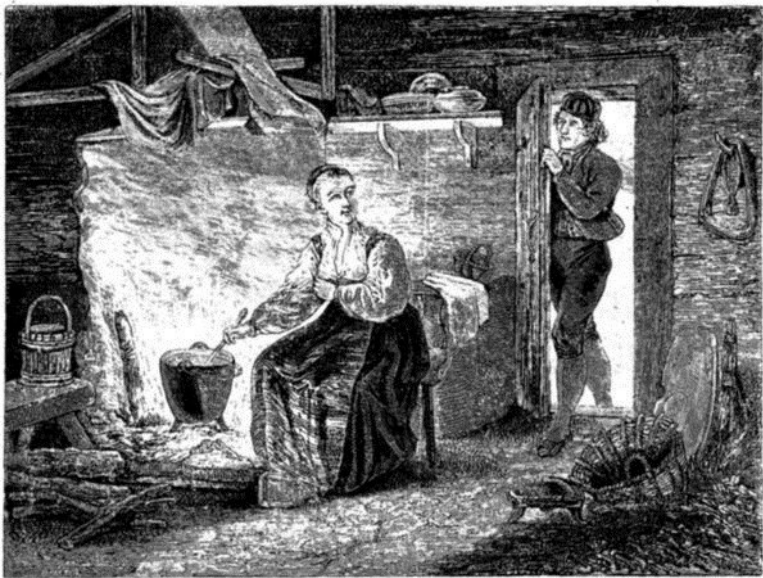
Costumes norvégiens d'Hitterdal.—Dessin de Pelcoq d'après le peintre norvégien Tiedeman.