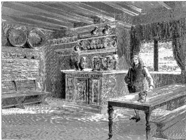
Intérieur d'auberge à Bolkesjö.—Dessin de Lancelot.

Du haut de la montagne au versant de laquelle les dix ou douze bâtiments de la ferme sont semés, on jouit d'une vue magnifique sur le lac Fol qui occupe le fond de la vallée et sur les plateaux boisés de Hofvin, tandis que vers l'ouest se découpe la cime neigeuse du mont Gausta.