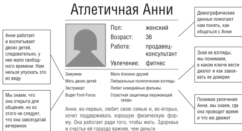
Рисунок 1.3. Пример обобщенного портрета покупателя

ленные выше, помогут нарисовать обобщенные портреты покупателей ( personas ) 15 . Пример можно увидеть на рисунке 1.3. Это эффективное описание ваших сегментов. Большинство компаний рисуют от пяти до десяти обобщенных портретов покупателей, потому что если их слишком мало, то они описывают чересчур большие и общие сегменты, а если их слишком много, то сегменты чересчур малы и подход становится излишне индивидуальным.