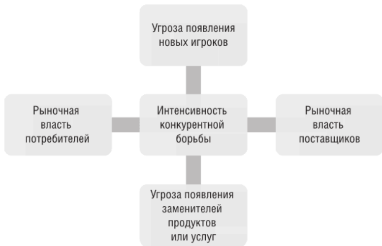
Рисунок 1.1. Пять сил Портера

Далее необходимо рассмотреть модель пяти сил Майкла Портера 12 . Она используется для анализа уровня конкуренции в отрасли путем использования экономики промышленных организаций. Цель – эффективно оценить картину конкуренции и потенциальную доходность отрасли. Любые из-