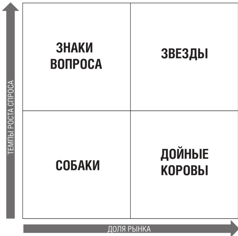
Рисунок 1.4. Матрица Бостонской консалтинговой группы

В БКГ-матрице показана не только категория каждого продукта, но и его доля в общей продукции компании. Всё это позволяет понять ценность каждого продукта. Матрица дает актуальный срез прибыльности продукции и потоков