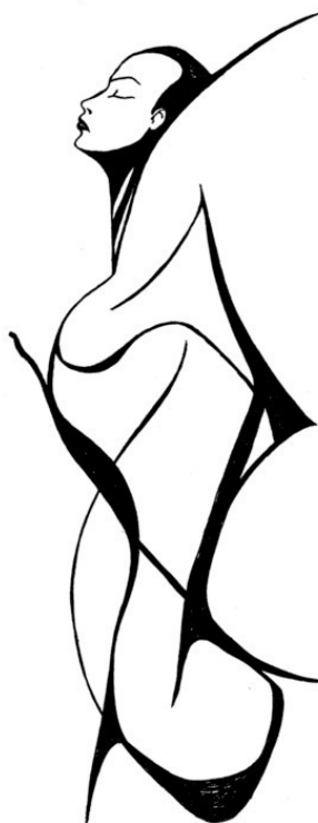
Острота ощущений (тушь, перо, 1993г., Л. Захарова)