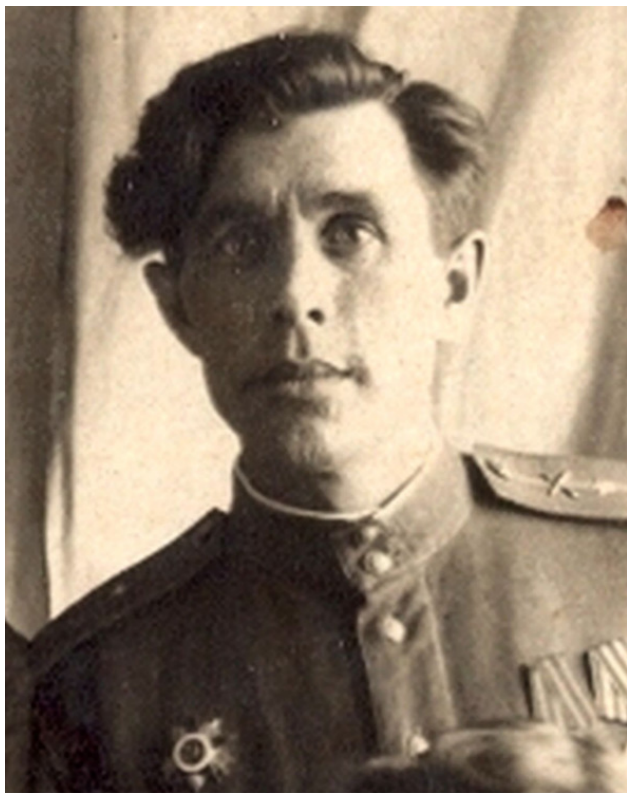
Федот Симонов (1917—1989)