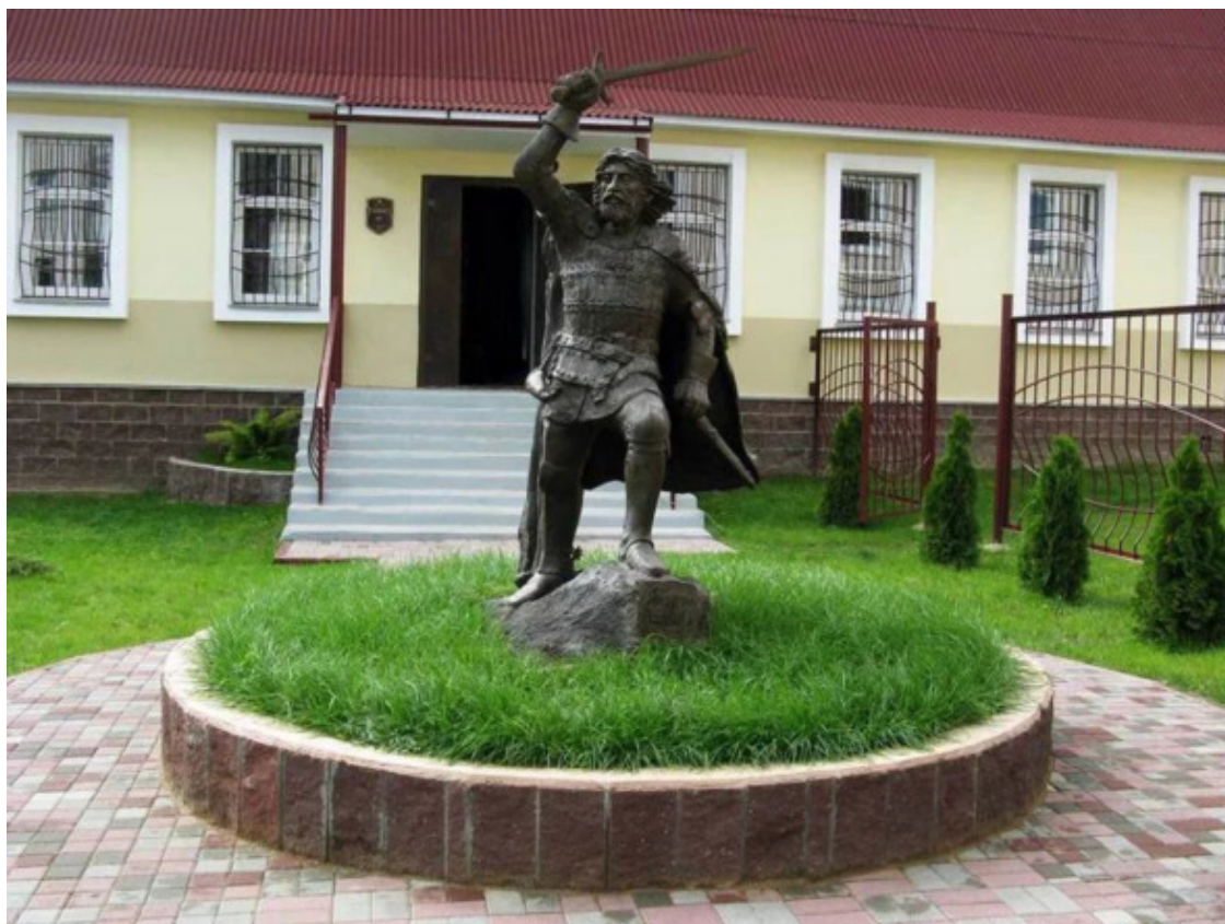
Андрей Ольгердавич-князь Полоцкий 1325—1399 г. г. Памятник, находящийся в Полоцке.

«началась борьба за главенство между Витебской, Минской и Друцкой ветвями потомков Всеслава Брючиславича. Это привело к захвату части земель Полоцкого княжества новгородцами, смоленскими и черниговскими князьями. Испытывало давление Полоцкое княжество также со стороны литовцев и крестоносцев».