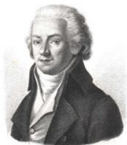
ST TH ZIEMMERING.