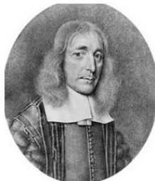
Рис. 1. Томас Уиллис

В 1726 г. британский анатом Александр Монро Примус подробно описал сообщение барабанной струны с языковым нервом (ветвь тройничного нерва). В 1778 г. немецкий анатом и физиолог Самуэль Томас Земмеринг разделил два нерва (рис. 2). В его работах лицевой нерв стал VII парой черепных нервов, впервые получив название Facialis . Facialis – это постклассическое латинское слово, которое происходит от латинского слова facies – лицо. Также Томас Земмеринг описал промежуточный нерв, который свое название получил из-за расположения между твердой и мягкой частями V галеновской пары. Названия, предложенные Томасом Земмерингом, были утверждены в 1895 г. в швейцарском Базеле, и такими остались после последнего пересмотра анатомической номенклатуры в Сан-Паулу в 1997 г.