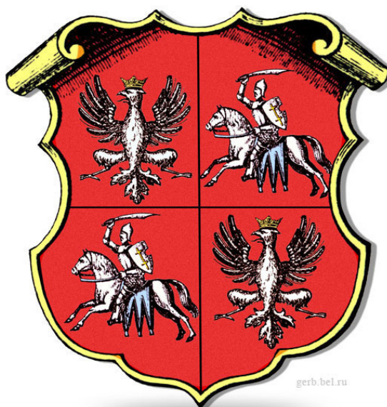
Герб Речи Посполитой образца XVII века.

Официальное название страны: Королевство Польша и Великое княжество Литвания (Regnum Poloniae Magnus Ducatus Lithuaniae).