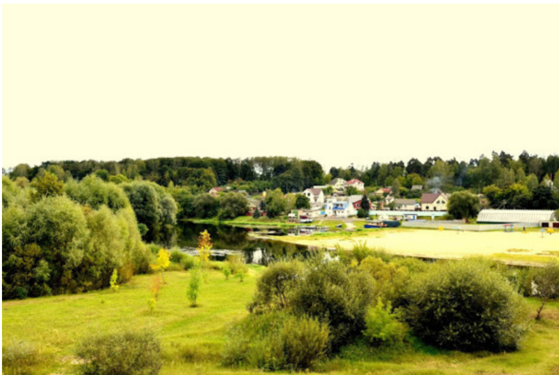
Настасся Цэрковіч. Фото из источника в списке литературы [4]

под названием Сха было обозначение речки Борисы как раз в районе Старо-Борисова. Хотя кто знает, может эта речка (если она на самом деле существовала, была названа с ориентацией на название города.