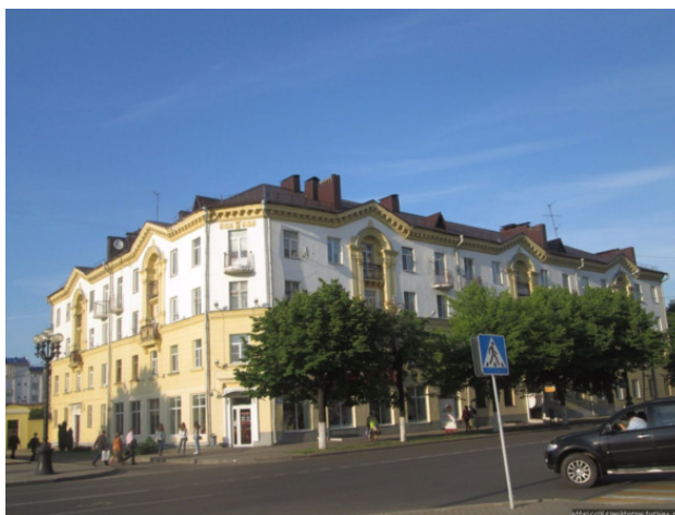
Glebwiktorow Фото из источника в списке литературы [2]

Этот город считается по беларуским масштабам крупным промышленным городом, городом большим количеством разного рода предприятий, организаций и учреждений (в том числе образовательных).