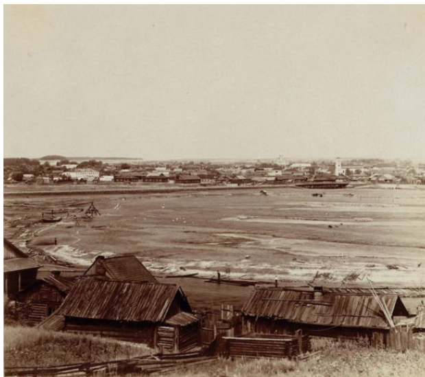
Фото из источника в списке литературы [10]

Год 1793-й. Борисов превратился в часть Рос. Империи, когда произошел второй раздел Речи Посполитой. Был центром ремесел, а стал уездным обычным городком.