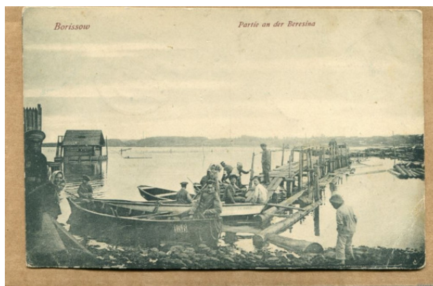
1918 год. Борисов, Березина. Фото из источника в списке литературы [88]

Год 1919-й (февраль, двадцать седьмое число). Борисов стал частью «Литовско-Белорусской Советской Социалистической Республики».