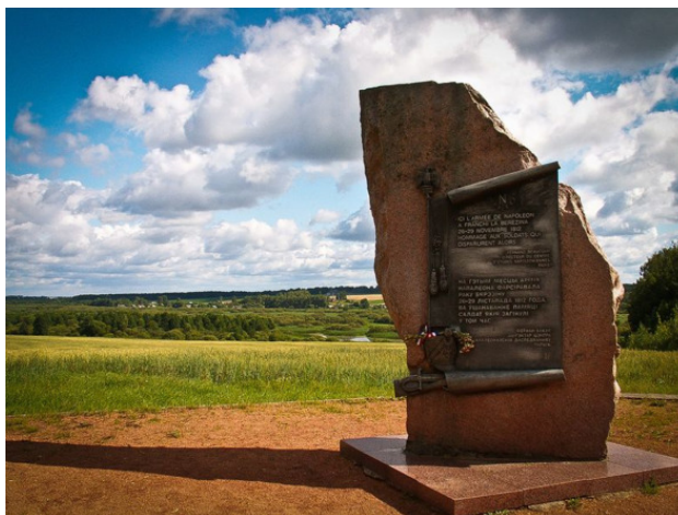
Брилевское поле. Фото из источника в списке литературы [13]

О памятниках, напоминающих о войне 1812-го года [14]: