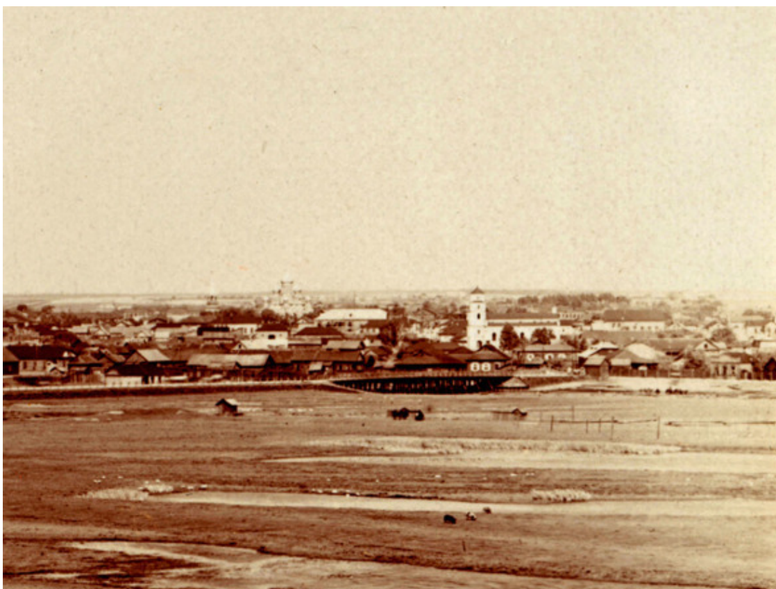
Фото из источника в списке литературы [7]