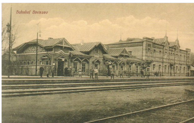
Борисов. Вокзал, 1918. Фото из источника в списке литературы [15]

Год 1917-й. Данный год стал для Борисова годом установления власти «советов».