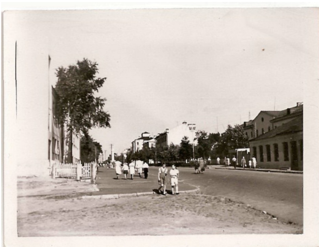
Фото: одна из улиц Борисова. Конец 1940-х – начало 1950-х гг.