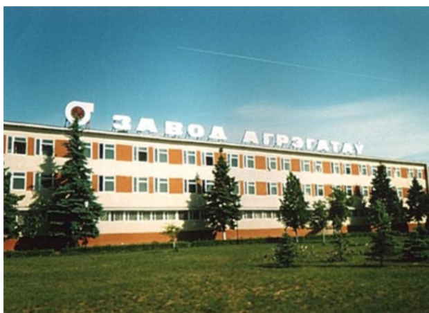
Фото из источника в списке литературы © 2006—2018. [25]

О предприятии ОАО «Борисовский завод агрегатов»