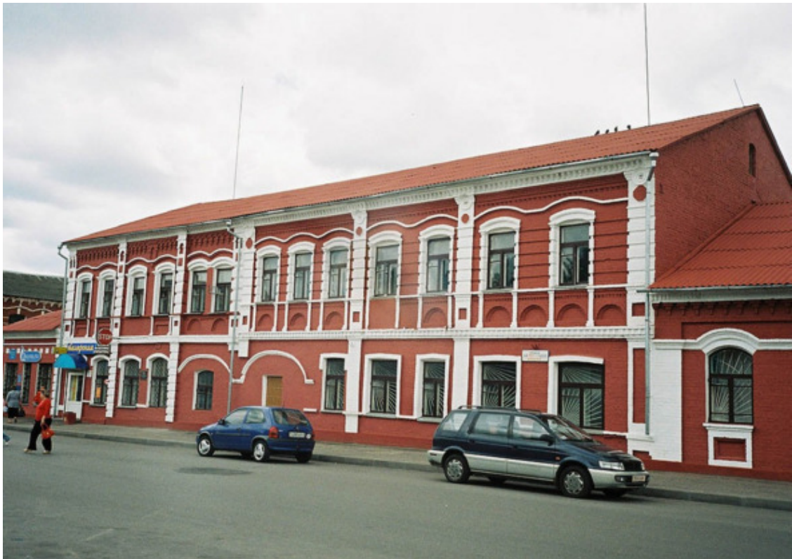
Фото из источника в списке литературы [22]

Две части Борисова являются совершенно разными (разнящиеся между собой города). Они находятся поблизости друг от друга, их сегодня объединяет одно название. Однако, они выросли в разных государствах, в них проживало разное население, между ними в прежние времена было перманентное конкурентное противостояние. Все, разумеется, «приладилося», замазалось краской времени, но следы прошлого все еще сохраняются.