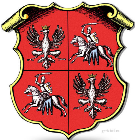
Герб Речи Посполитой образца XVII века.

Официальное название страны: Королевство Польша и Великое княжество Литвания (Regnum Poloniae Magnus Ducatus Lithuaniae).