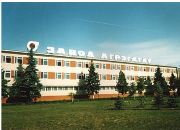
Фото из источника в списке литературы © 2006—2018. [25]

О «Старом» Борисове есть видео: https://www.youtube.com/watch?v=34xa6Zdzt80