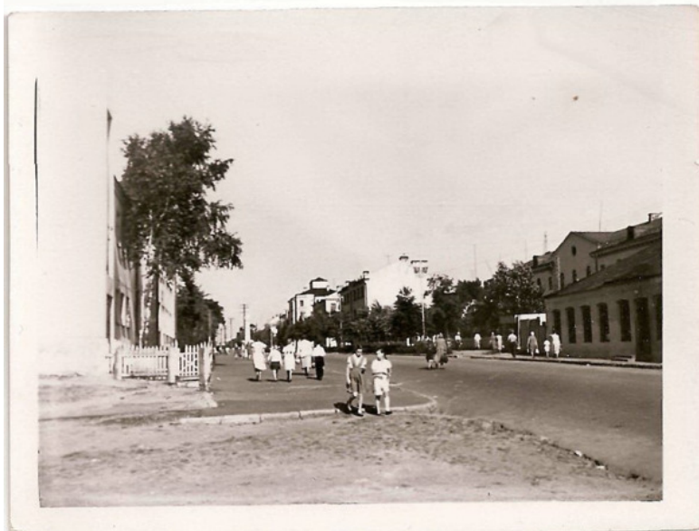
Фото: одна из улиц Борисова. Конец 1940-х – начало 1950-х гг. Фото из источника в списке литературы [16]