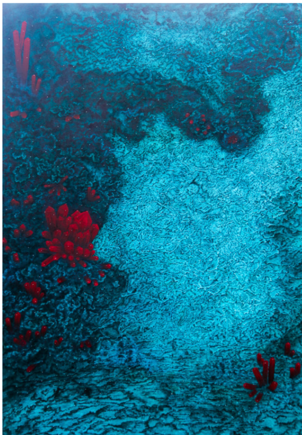
«Яхонт в азуромалахите» 120x80

Азуромалахит – в народе его называют синяя птица, покровитель всего живого на земле, каждый кусочек этого камня гармоничное объединение в единый узор. Напоминающий мини-атюрную планету с азуритавыми морями и океанами и малахитовыми континентами.