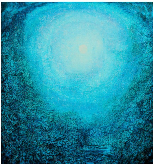
«Преображение» 2016г 80x70

Какая прекрасная музыка Спустилась с небес, Земля ещё слов не придумала Чтоб Славу Любви воспеть, Какая прекрасная музыка Окутала радугой ум Проникла как дождь морозящий Забывший что солнечный день, В пейзажи росой упавший Рассыпав лучи на цвета, Оранжевый диск ускользавший По струнам Ультрамариновых виолончель. Какая прекрасная музыка, Прозрачная арфа плывёт По синему тёплому небу И тысячи скрипок ведёт, Неслышно вступают одна за другой Как будто весна наступает волной, Какая прекрасная музыка Слышна из небесных глубин Там ангелы в вышних обителях Играют во славу Творцу.