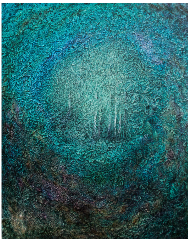
«Каменная роща» 2015г, 100x80

Березы, белая строка Поэту на душу легла, То листья трепетно хранит Всё лето слабая дрожит, А то как властная гордыня, Исписанными листьями сорит, А то как белая невеста, Прелестна, кроткая стоит. А то как женщину В рассвете сил, Не трогает строка Поэта, ветра И белый стан её, Всегда манит, Она сама себе весна А время года Для неё игра.