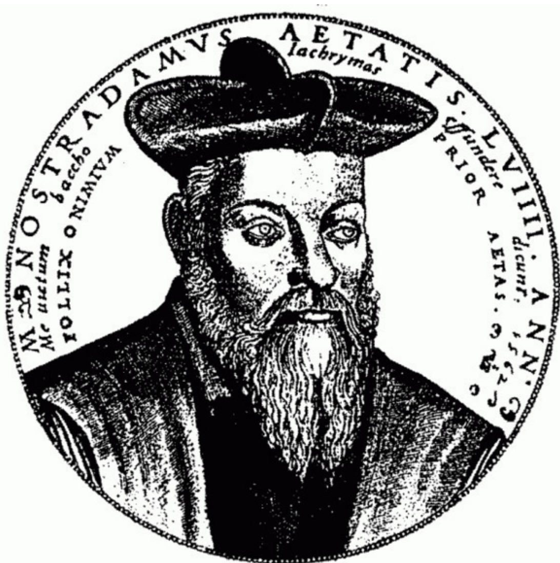
Прижизненный портрет Нострадамуса.

Но почувствовать на себе монаршее неудовольствие Нострадамусу было не суждено: 2 июля 1566 года его свела в могилу подагра, называемая иначе «болезнью гениев». На мраморном надгробии во францисканском монастыре высечена надпись: «Здесь покоятся кости знаменитого Мишеля Нострадамуса, единственного из всех смертных, который оказался достоин запечатлеть своим почти божественным пером, благодаря влиянию звёзд, будущие события всего мира».