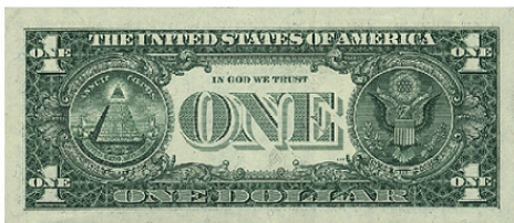
Один доллар США

Национальный гимн The Star-Spangled Banner посвящен американскому звездно-полосатому флагу. Написан в 1814 году, утвержден в качестве официального в 1931 г.