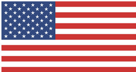
Современный флаг США