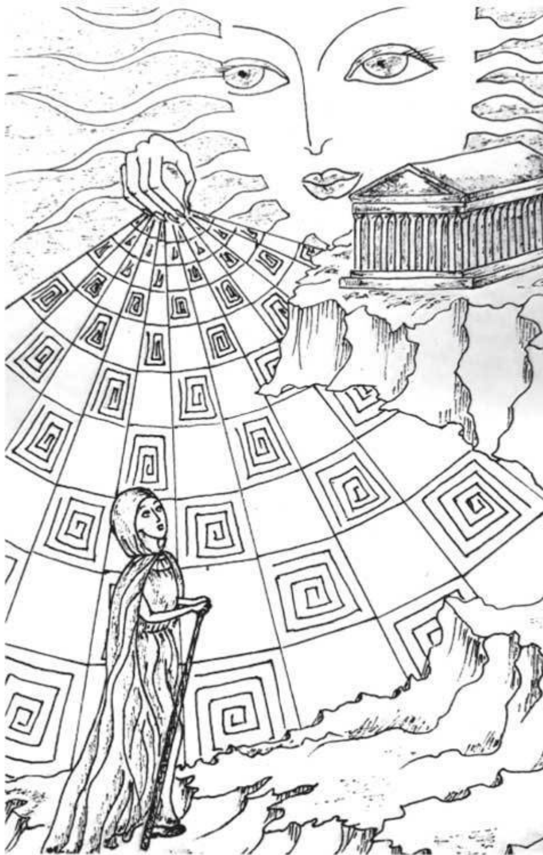
Тихостопная вязь... Тихостопная вязь