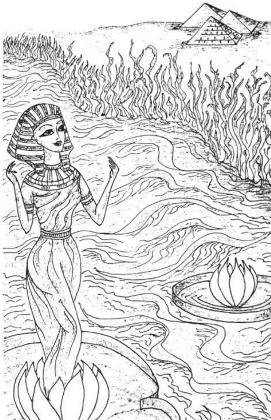
Бьет прохладный фонтан... Бьет прохладный фонтан