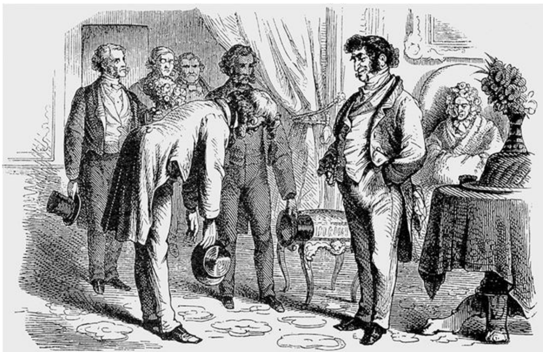
1.1. Неизвестный автор. 99-я годовщина бабушки. Fliegende Blätter (ок. 1848)

В тот период семью Ротшильд постигла настоящая череда смертей. За год до Гутле скончалась Ева, жена Амшеля. В 1850 г. умерли вдова Натана Ханна, а также – к огромному огорчению парижских Ротшильдов – ее младший внук Майер Альберт, второй сын Ната. В 1853 г. умерла Адельгейд, жена Карла. Через год та же участь постигла Каролину, жену Соломона. Нетрудно представить, как подействовали эти события на старших представителей второго поколения. Майер Карл отмечал, как «глубоко поразила» Амшеля смерть матери: «Это огромная потеря [для него]... и я не могу передать, сколько ужасных часов провели мы за последнее время... Дядя А. не выходит из комнаты, но ему уже лучше после первого удара, когда мы в самом деле боялись за него». Он стал лишь слегка «спокойнее», когда семья собралась во Франкфурте на похороны Гутле. Более того, в преклонном возрасте Амшель и его брат Соломон выглядели совершенно несчастными. Они все меньше и меньше времени проводили в «конторе» и все больше – в саду у Амшеля.