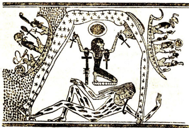
Нут и Геб. Древний Египет.