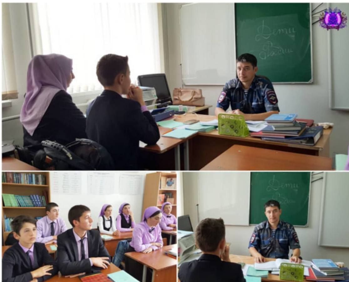
Сотрудник ПДН, 9 кл.

В целях предупреждения распространения наркомании среди несовершеннолетних, выявления фактов их вовлечения в преступную деятельность, а также повышения уровня ответственности о последствиях употребления наркотиков и участия в их обороте сегодня сотрудники ПДН ОМВД России по Итум-Калинскому району в рамках операции «Дети России» провели профилактическую беседу с учащимися МБОУ «СОШ с. Тазбичи имени Г. Х. Юсупова». Сотрудники правоохранительных органов объяснили учащимся, почему употребление наркотиков негативно отражается на здоровье человека. Полицейские также рассказали ребятам об ответственности за хранение и распространение наркотических веществ. В ходе проведения операции стражи порядка отвечали на вопросы школьников. Ребята принимали активное участие в профилактической беседе. Все они хотят быть здоровыми и счастливыми, а значит наркотикам в их жизни – не место.