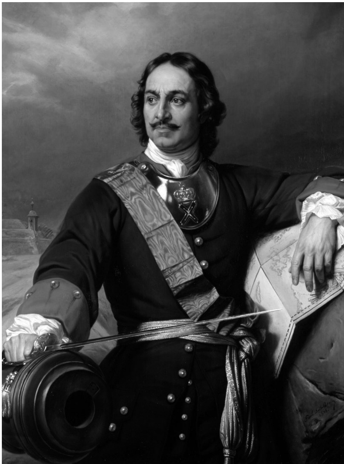
Рис. 1. Портрет Петра I. Художник Поль Деларош (1838). Hamburger Kunsthalle, Hamburg

Сам Петр I в юные годы волею случая был «отторгнут из дворцовой кремлевской среды... его воспитателями стали не московские попы и дьяки, а голландские матросы и плотники» 10 , никакого систематического научного образования он не получил, а потому имел лишь весьма смутные, обрывочные представления о современной ему науке. «Дивно всякому было легко