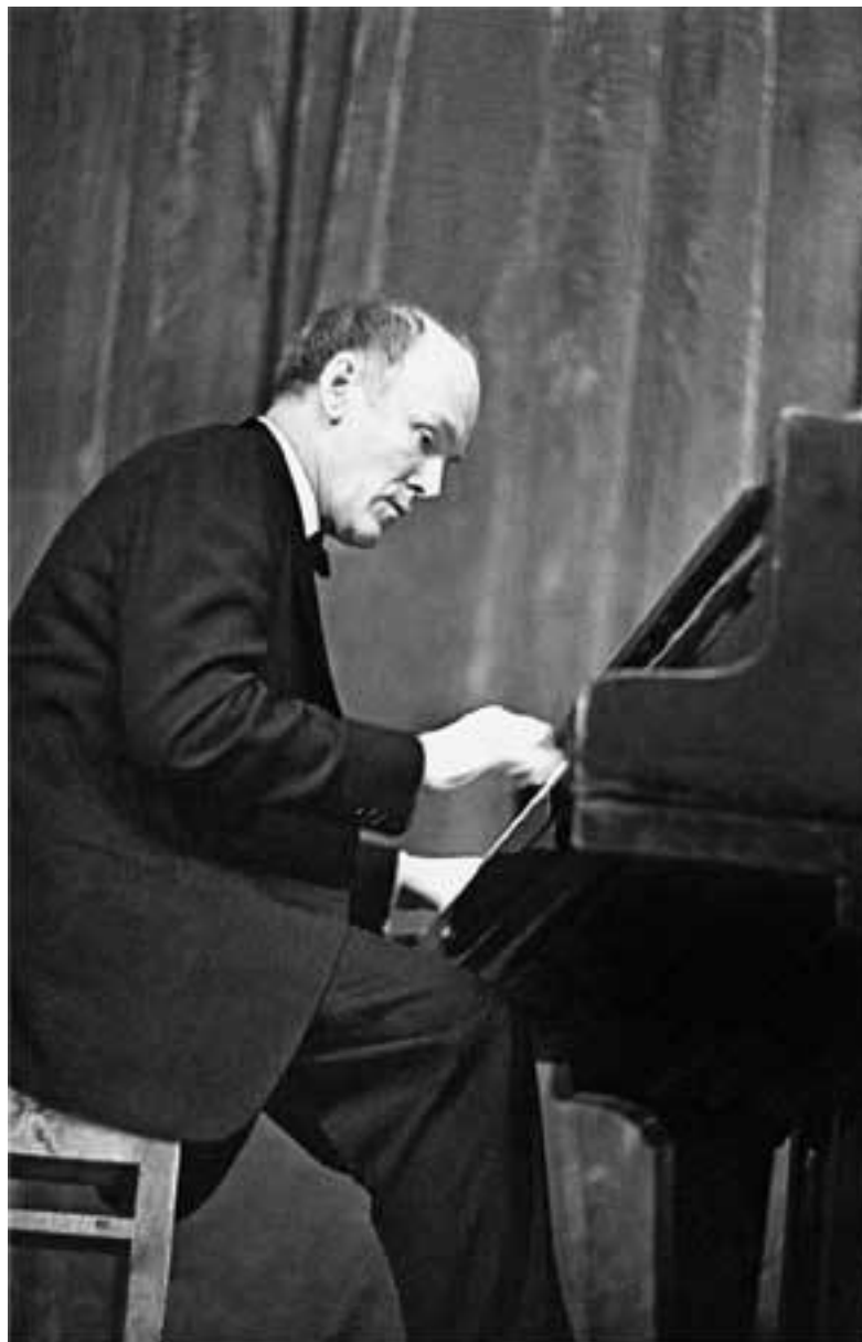
Святослав Теофилович Рихтер (1915–1997)