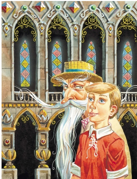
Рисунки Владимира Канивца